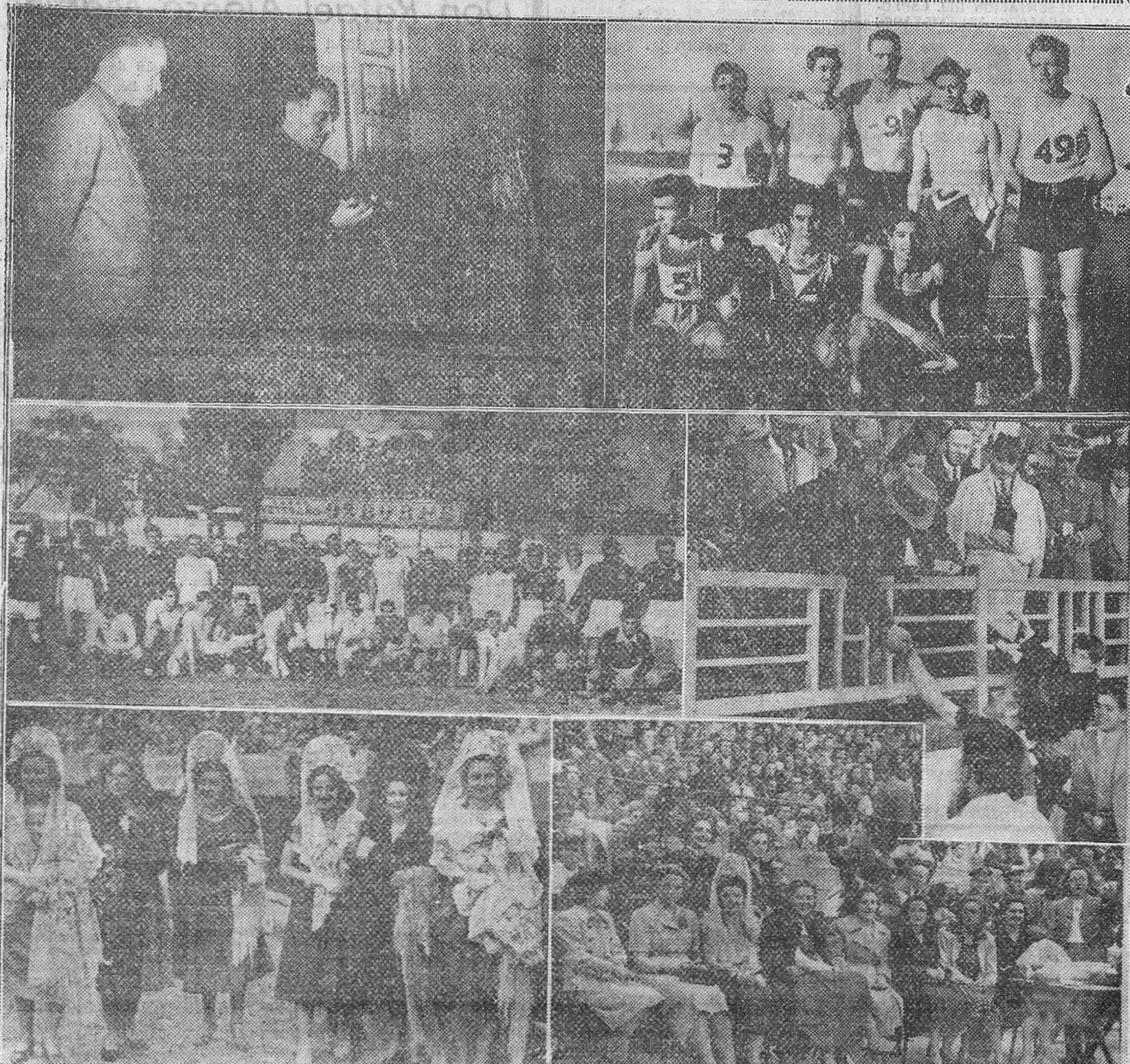
REPORTAJE GRAFICO DE "FEDE" DE LOS ACTOS CELEBRADOS EN BURGOS CON MOTIVO DE LA FESTIVIDAD DE SAN FERNANDO. -- De izquierda a derecha, arriba: el subjefe provincial del Movimiento imponiendo los corbates a los guioneros de las Centurias del Frente de Juventudes y el equipo de atletismo de la Centuria "Almirante Bonifaz" vencedor en las pruebas deportivas celebradas el domingo.--En el centro, los equipos de fútbol de las Academias de Ingenieros e Infantería que empataron en Zatorre y, el capitán general de la Región entregando los trofeos a los capitanes de ambos conjuntos. -- Abajo, madrinas del festival taurino celebrado ayer tarde y señoritas que amadrinaron a los ecballeros cadetes en la Gimkhana.

Madrid.—En el salón de actos del Consejo Superior de Investigaciones Científicas ha pronunciado una conferencia el ministro de Justicia y secretario general del Movimiento, como clausura del curso de orientación general a los problemas educativos del Magisterio.