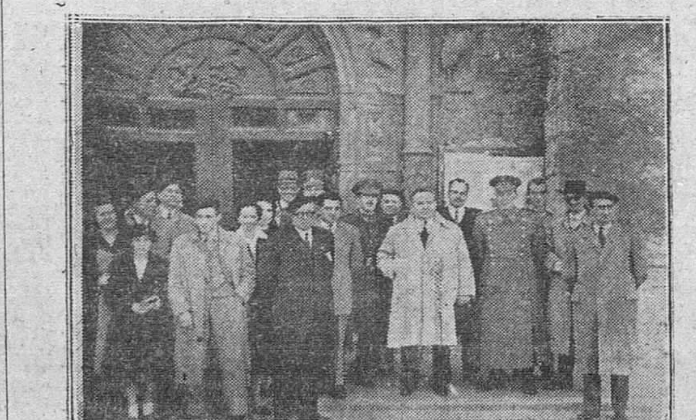
LOS ALAVES RESIDENTES EN NUESTRA CIUDAD, SOLEMNIZARON AYER LA FESTIVIDAD DE SAN PRUDENCIO, PATRONO DE ALAVA. AQUI VEMOS A UN GRUPO DE ASISTENTES A LA MISA CELEBRADA EN LA IGLESIA DE SAN COSME Y SAN DAMIAN, FOTOGRAFIADOS A LA SALIDA DEL TEMPLO.