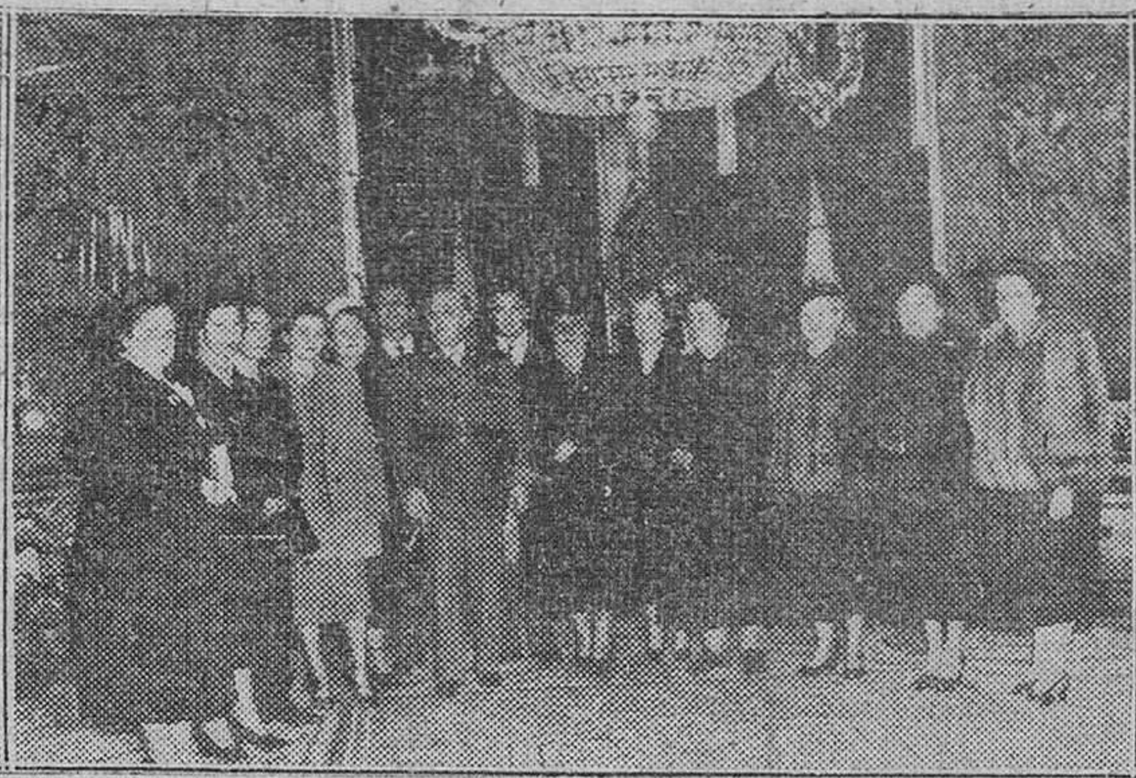
El Pardo.—Su Excelencia el Jefe del Estado recibió en el Palacio de El Pardo a una peregrinación de señoras de Colombia, de paso para Roma, acompañadas del agregado del citado país, señor Carreno.

Lake Success.—Rusia se ha retirado de la Comisión de desarme de las Naciones Unidas después de fracasado por un voto de diferencia, su propuesta de enviar al Gobierno norteamericano un representante en dicho Organismo. También como en ocasiones anteriores, antes de retirarse de la Comisión, Malik dijo que Rusia no reconocía la validez legal alguna a las decisiones que se adopten en su ausencia. —Efe.