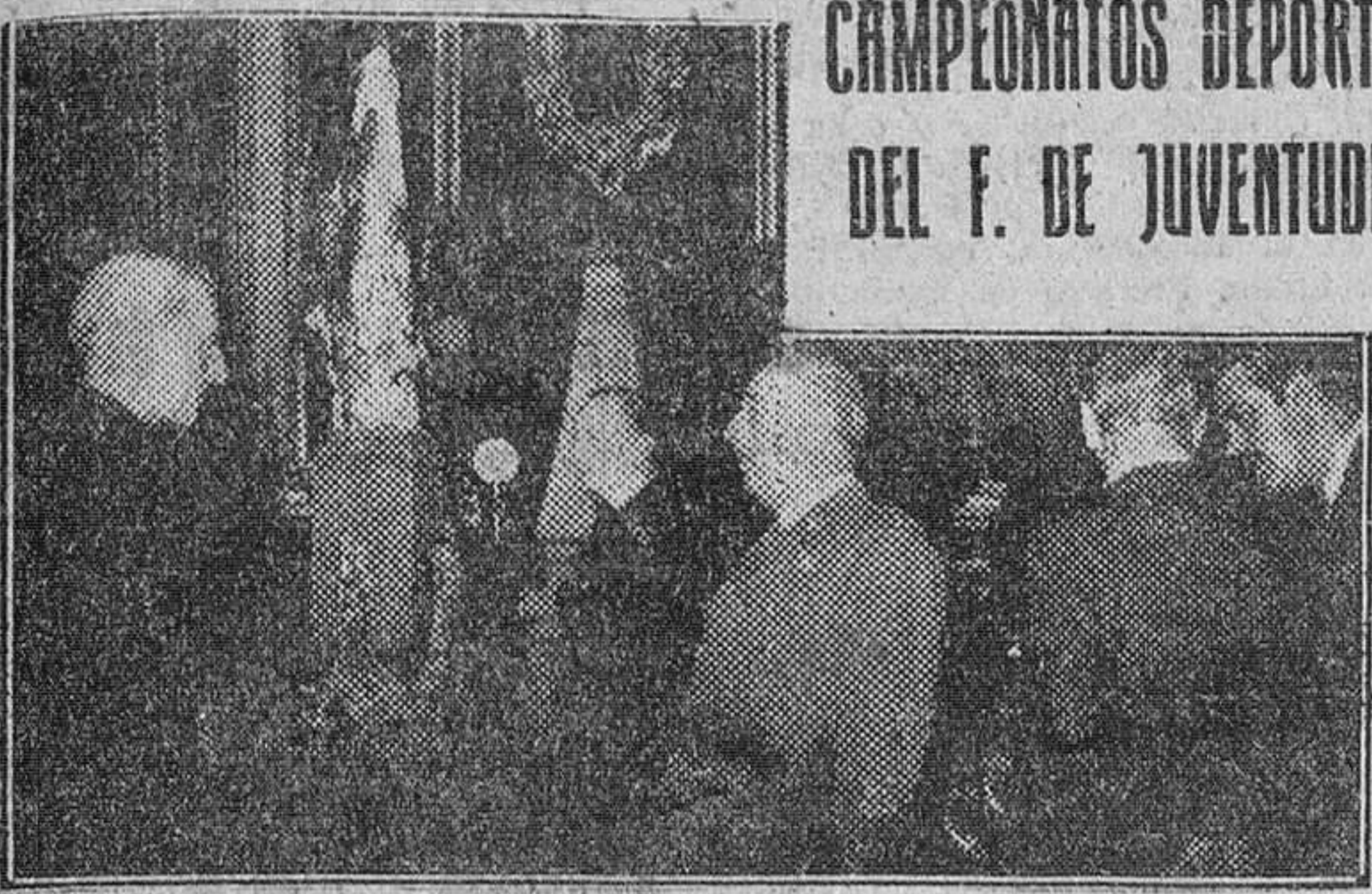
Madrid.—S. E. el Jefe del Estado en el acto de entregar el Trofeo Deportivo para el F. de Juventudes de Barcelona y el Guión para el F. de Juventudes de Valencia como ganadores de los campeonatos deportivos de la Organización.