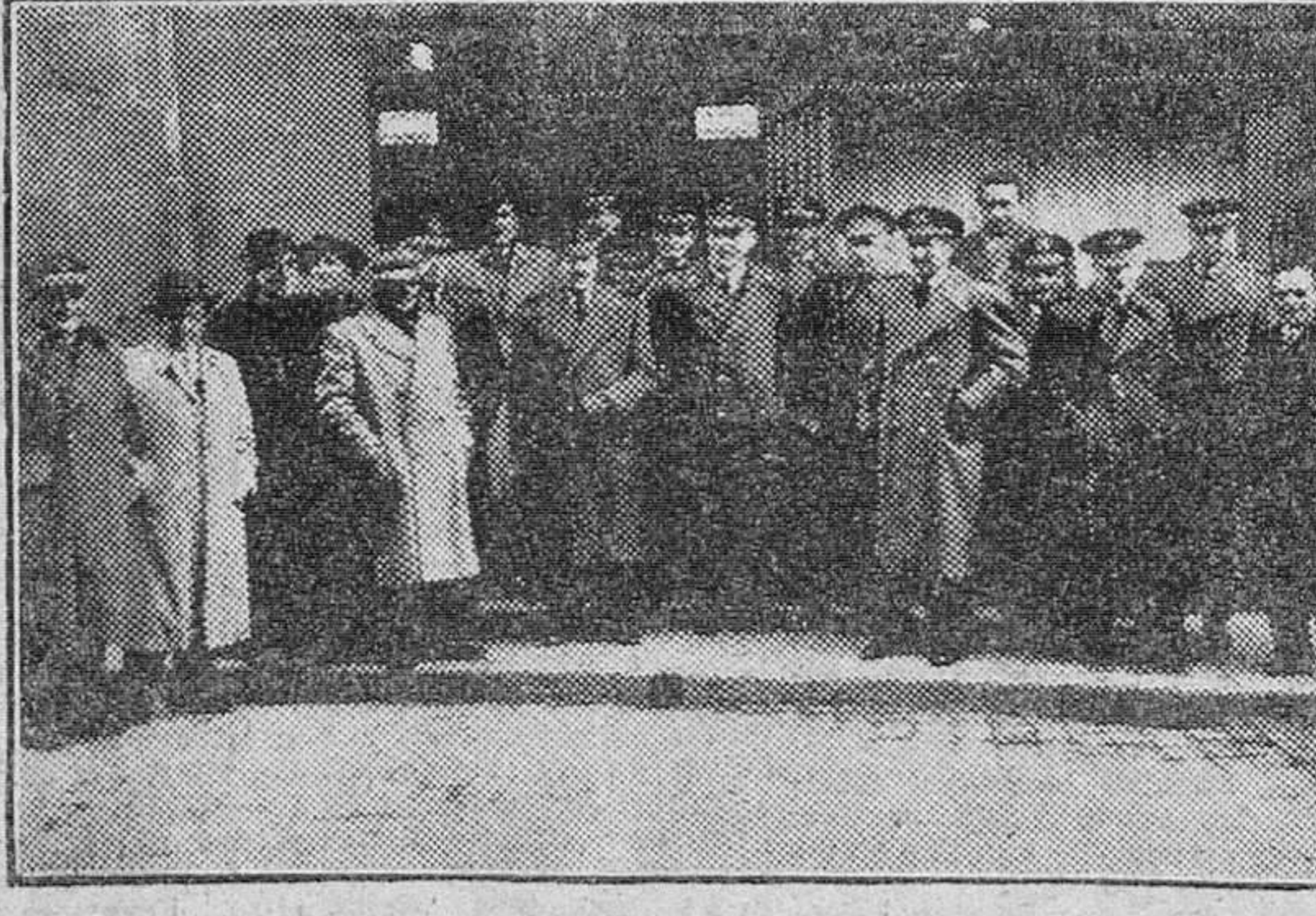
Ayer dieron comienzo los actos organizados por la Aviación, en nuestra ciudad, con motivo de la fiesta de su Patrona, que conmemoran hoy. En nuestra foto, un grupo de concurrentes al almuerzo celebrado a mediodía de ayer