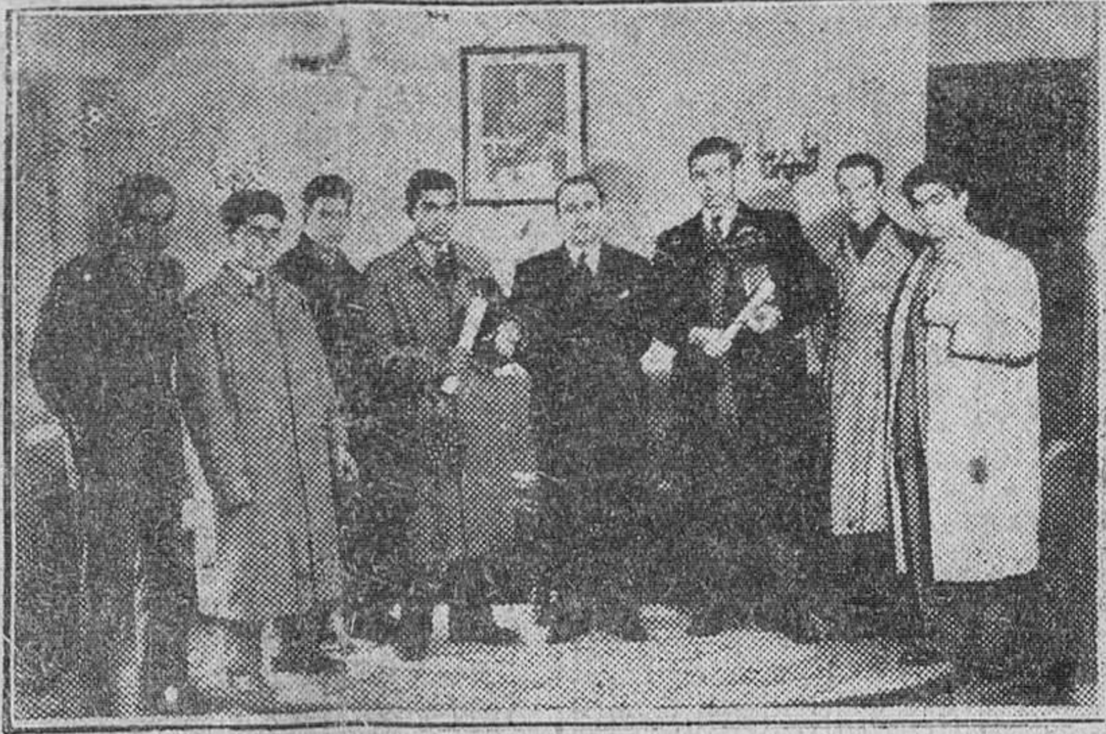
De regreso en nuestra ciudad, los aprendices burgaleses triunfadores en el Concurso nacional de Formación Profesional del Frente de Juventudes fueron recibidos ayer por el señor gobernador civil, con el cual aparecen en la precedente placa.

"Pueblo", de Madrid, lo proclama así, en una entrevista con los galardonados en el reciente Concurso nacional