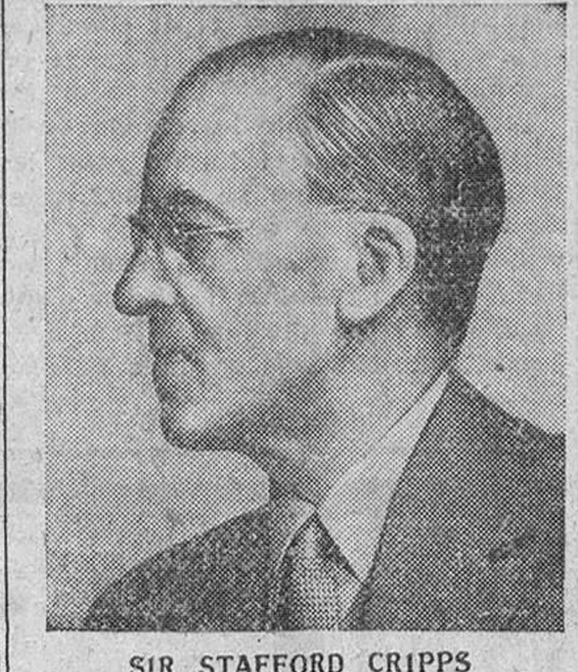
SIR STAFFORD CRIPPS

La Delegación provincial de Estadística nos remite el siguiente comunicado: "Se recuerda al vecindario de Burgos que han dado comienzo los trabajos para el Censo de Edificios y Viviendas de esta ciudad. Que para los efectos de este Censo han de ser visitados, en sus propios domicilios, todos y cada uno de los propietarios de inmuebles e inquilinos de las viviendas, a fin de obtener directamente de ellos la información que se precisa para llenar los documentos censales. Se recuerda, igualmente, que este Censo tiene una finalidad exclusivamente estadística, sin que puedan utilizarse las correspondientes informaciones para fines tributarios. También se recuerda que se recibirán y publicarán sólo como datos numéricos globales o de conjunto, de los cuales no puede deducirse nunca la situación de ningún edificio ni de ninguna vivienda en concreto".