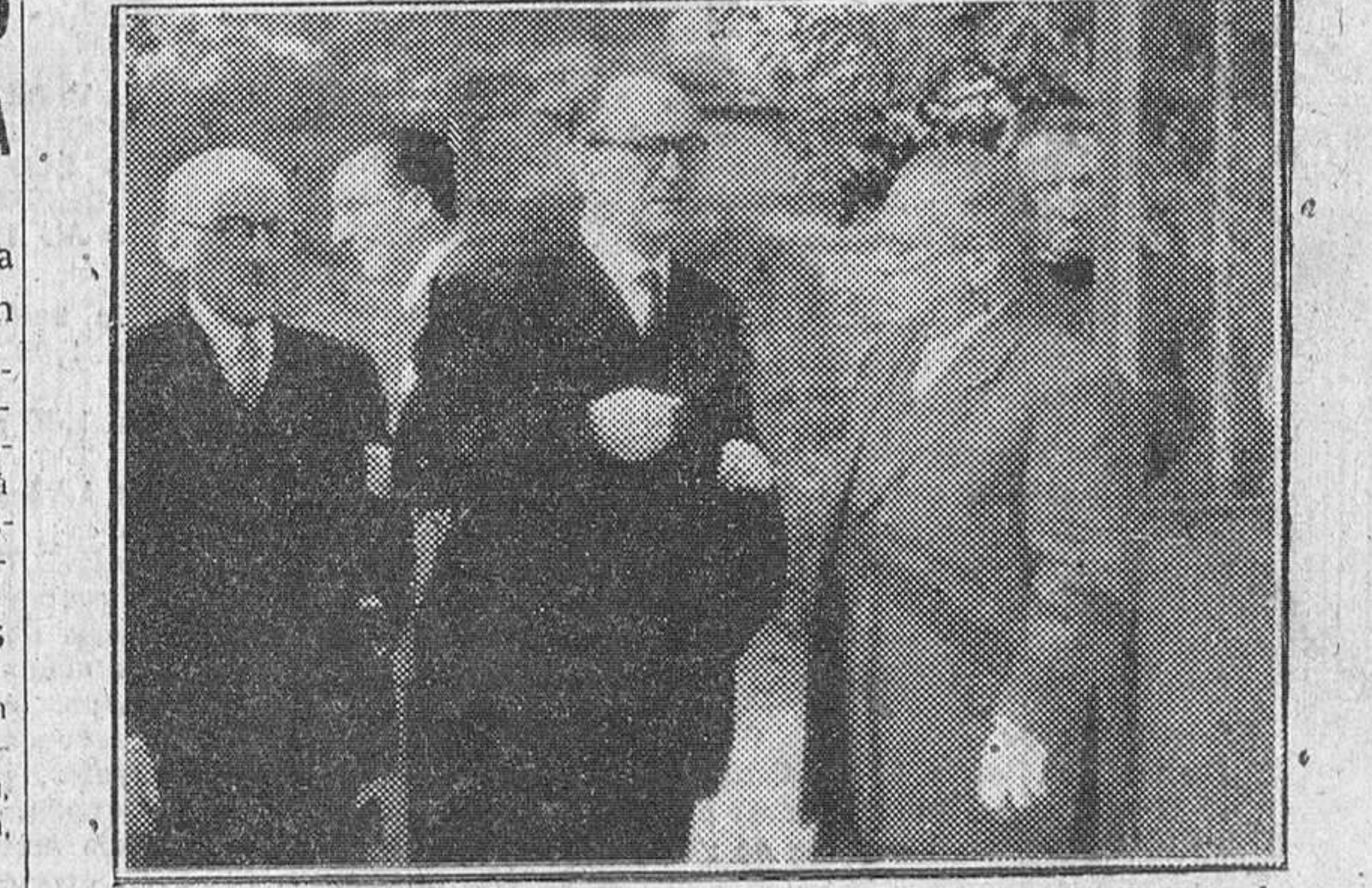
El Excmo. Sr. Ministro de Educación Nacional fotografiado durante las visitas que ayer realizó a la Casa de Miranda y al Instituto Nacional de Enseñanza Media, respectivamente.

Como anunciáramos en nuestra edición anterior, ha pasado unas horas en Burgos el excelentísimo señor ministro de Educación Nacional, señor Ibañez Martín.