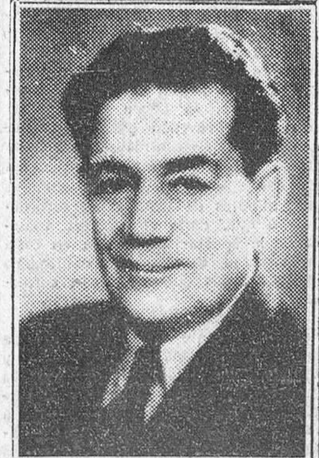
OMAR ZAKI PACHA AL AFIONNI, que ha sido nombrado ministro plenipotenciario de Jordania en Madrid.

Madrid. — En esta ciudad hacia las tres de la tarde. Pasará por Sevilla como un meteorito, pues, aunque ella hubiera querido, según ha manifestado en el hotel donde ha de alojarse, permanecer dos días para conocer sus monumentos y lugares artísticos, no podrá hacerlo, ya que ha recibido un cable con la noticia de que su madre se encuentra indisputa en los Estados Unidos. Por ello, "Miss América" ha decidido salir esta tarde, a las ocho en avión, para Lisboa desde donde seguirá directamente a los Estados Unidos.—Cifra