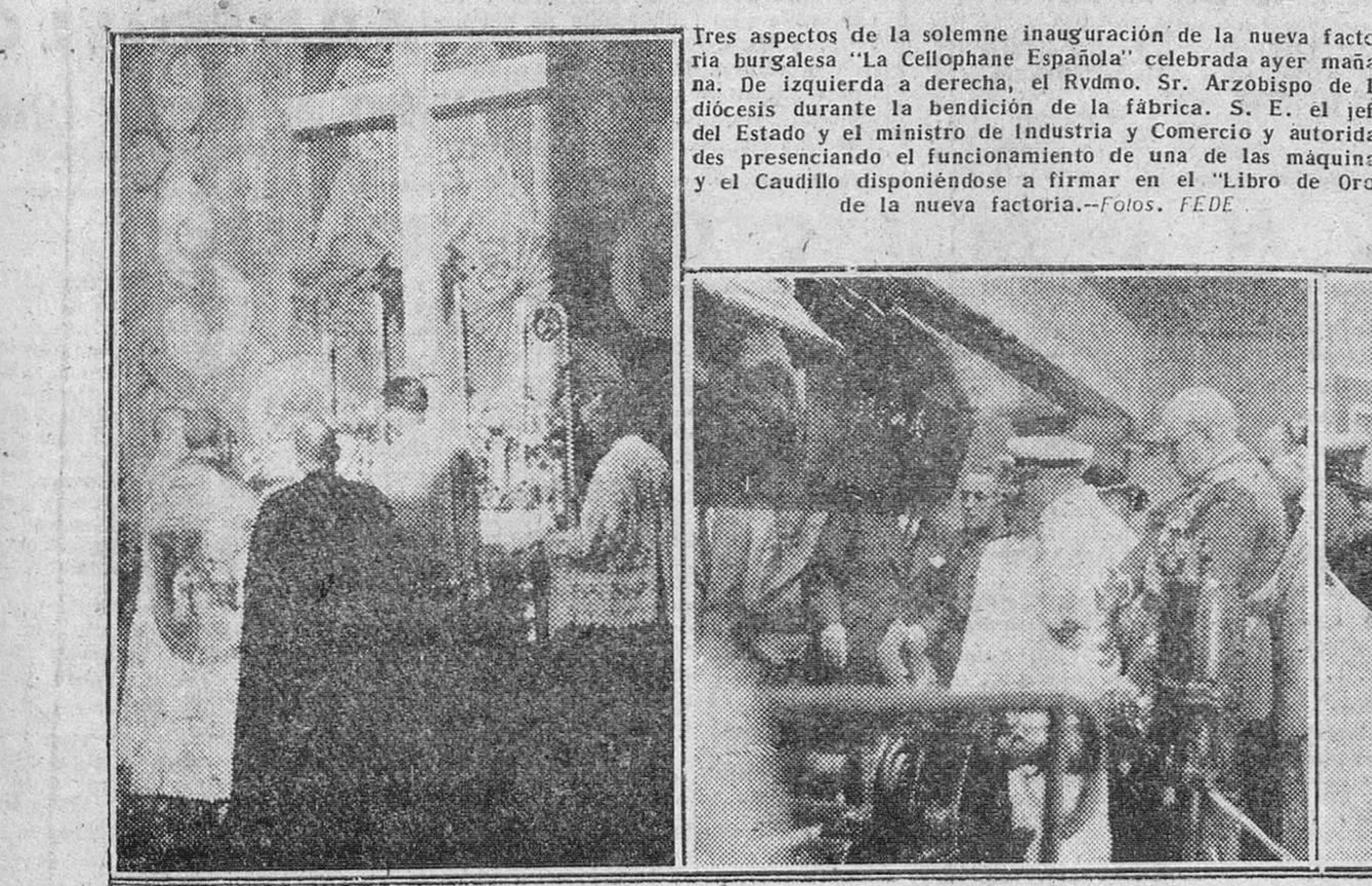
Tres aspectos de la solemne inauguración de la nueva fábrica burgalesa "La Cellophane Española" celebrada ayer mañana. De izquierda a derecha, el Rvdmo. Sr. Arzobispo de la diócesis durante la bendición de la fábrica. S. E. el jefe del Estado y el ministro de Industria y Comercio y autoridades presenciando el funcionamiento de una de las máquinas y el Caudillo disponiéndose a firmar en el "Libro de Oro" de la nueva fábrica.