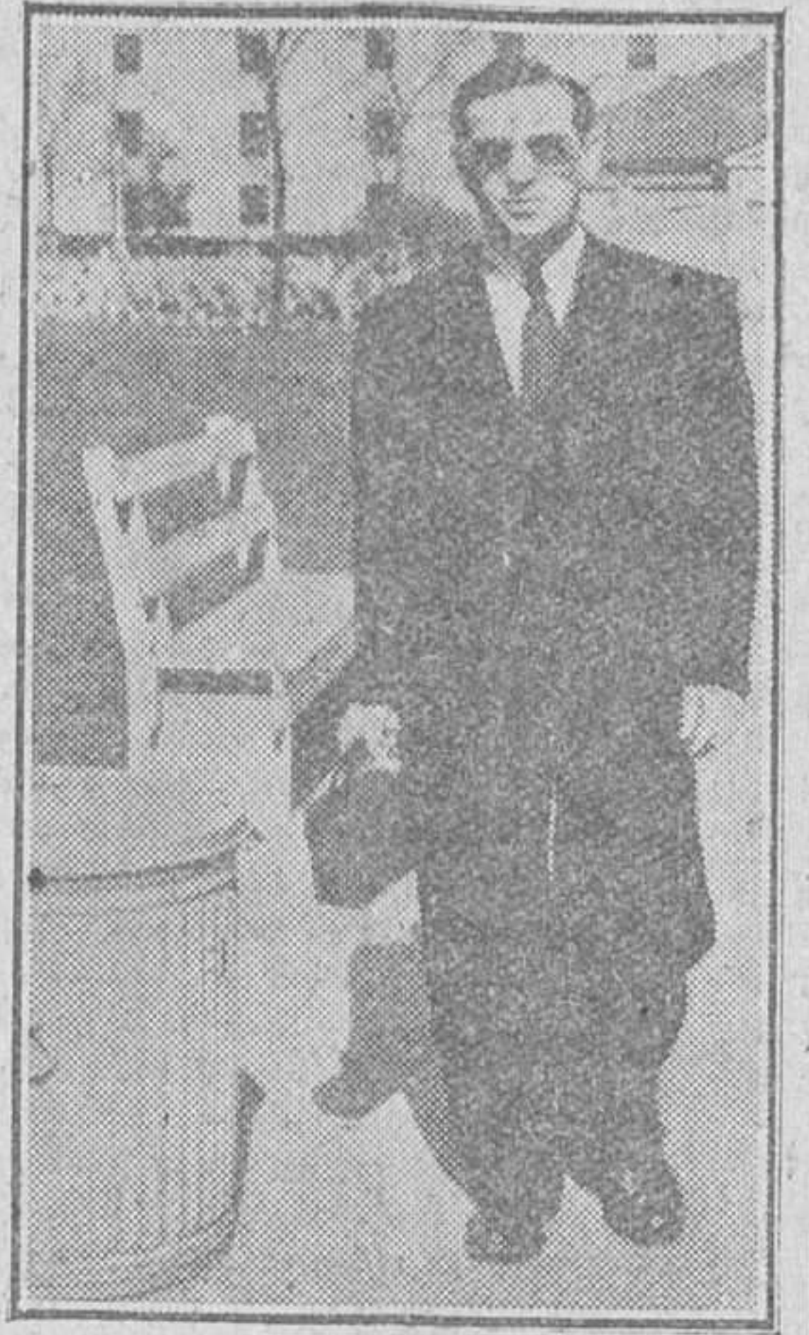
Un ciego se dirige a su lugar de trabajo provisto de la "linterna sonora".

WASHINGTON. (Especial para DIARIO DE BURGOS)