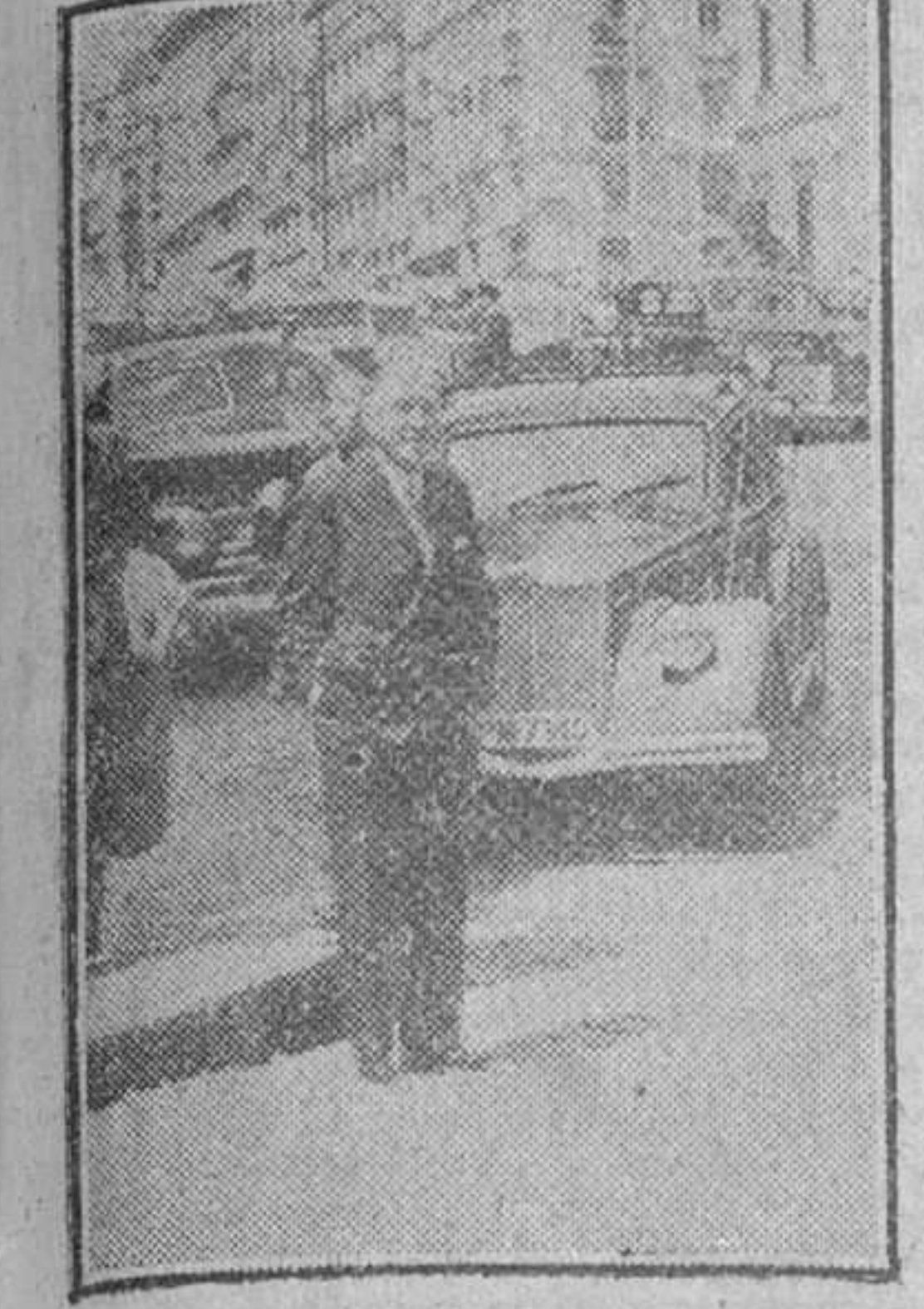
Madrid.—El ilustre escritor, don Ramón Pérez de Ayala, fotografiado en la Carrera de San Jerónimo, en su primer paseo por la capital española, después de su larga ausencia