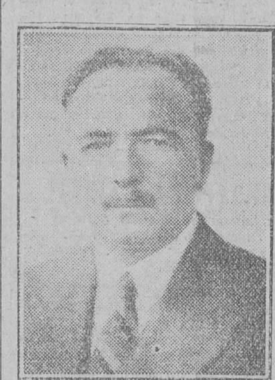
El señor Leo J. Mac Cauley, nuevo ministro de Irlanda en España