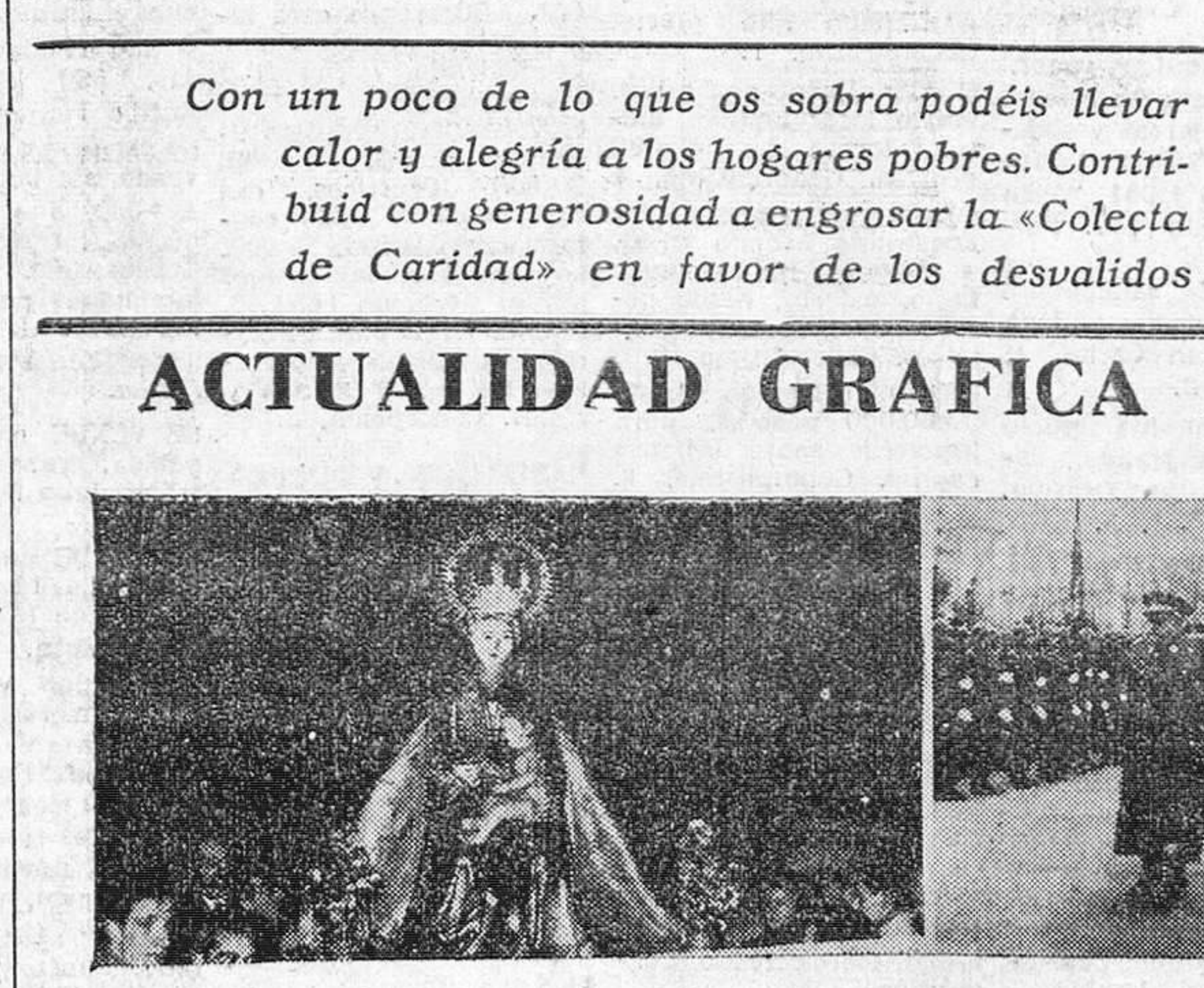
Las placas de "FEDE" sobre los actos religiosos de ayer, en Burgos.— A la izquierda, el momento en que llega a la iglesia parroquial de San Gil, en rogativa, la imagen de Santa María la Mayor. A la derecha, el capitán general revistando las fuerzas de Artillería, momentos antes de comenzar la misa solemne celebrada con motivo de