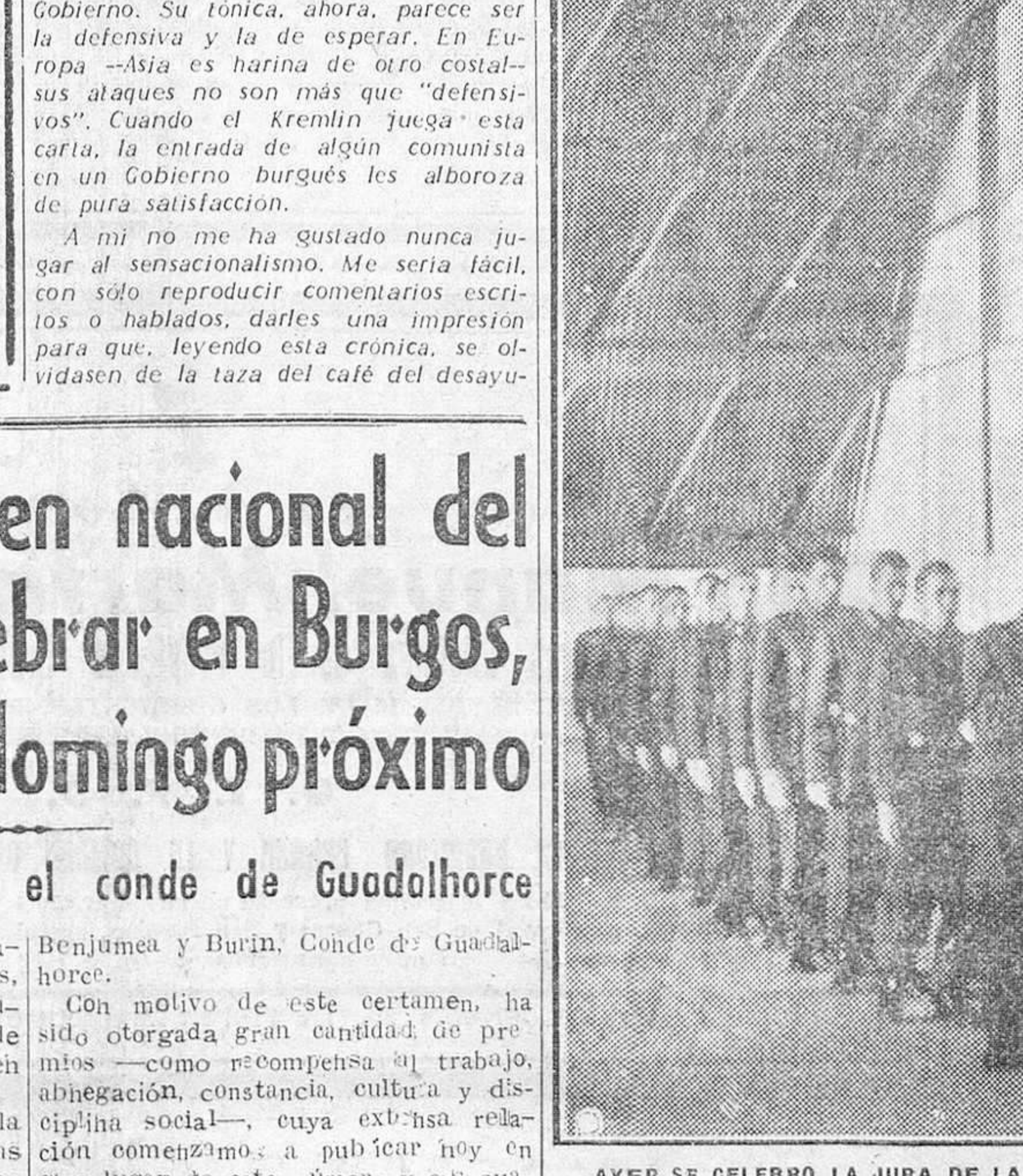
AYER SE CELEBRÓ LA JURA DE LA BANDERA POR LOS NUEVOS RECLUTAS, EN EL AERODROMO DE VILLAFRÍA, HE AQUÍ UN MOMENTO DE LA CEREMONIA