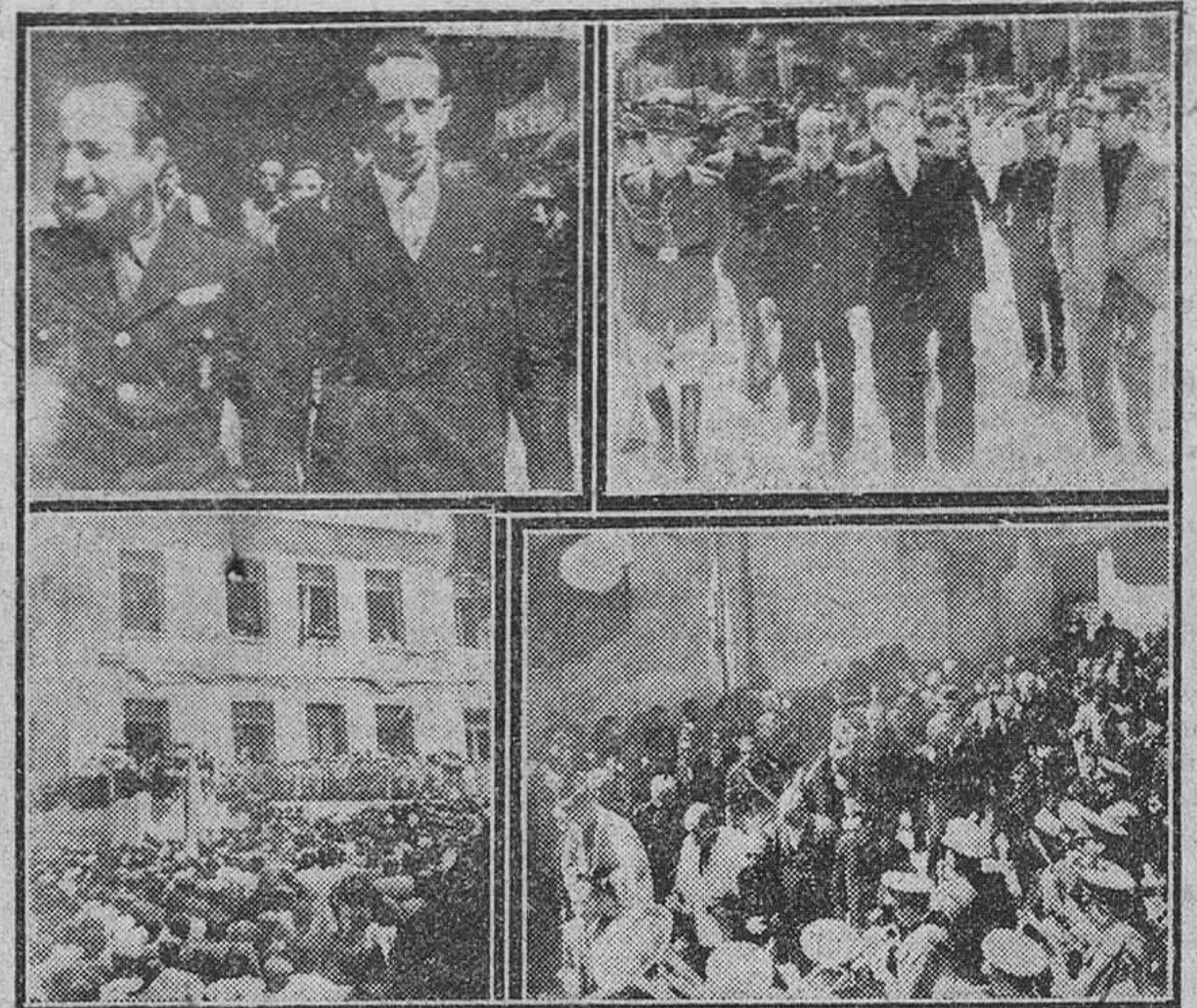
Diversos momentos de los solemnes actos celebrados ayer en Roa de Duero. Arriba (a la izquierda) el Excmo. Sr. Gobernador civil y jefe provincial del Movimiento con el alcalde de la villa. — Abajo, dos instantes de la bendición e inauguración del nuevo grupo escolar. En la foto superior de la derecha puede verse a las autoridades dirigiéndose al edificio Ayuntamiento desde donde presidió la gran concentración falangista celebrada por la tarde.

Gran concentración falangista y Asamblea de Hermandades de Labradores