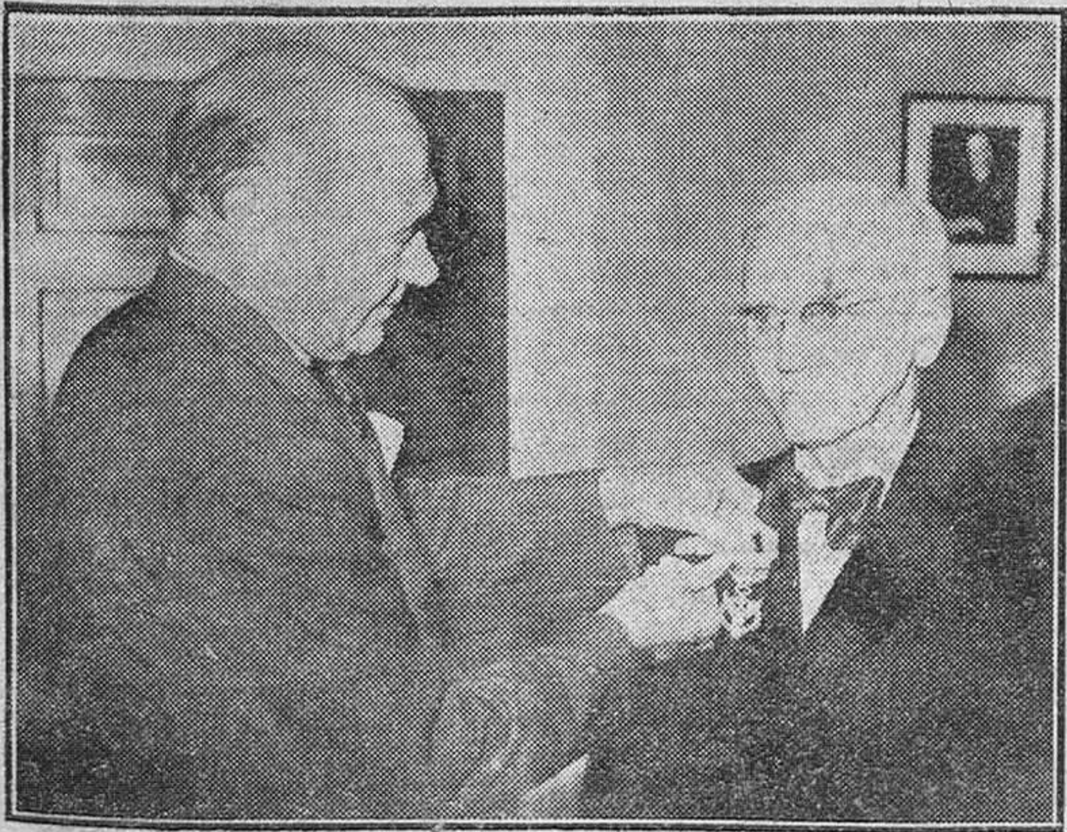
SIR ALEXANDER ES CONDECORADO CON LA MEDALLA DEL MERITO POR EL EMBAJADOR NORTEAMERICANO EN LONDRES EN REPRESENTACION DEL PRESIDENTE DE LOS ESTADOS UNIDOS

El profesor que descubrió la droga maravillosa que ha pasado a ser la penicilina —actualmente húsped de España— comenzó su vida en unos medios modestos. Nació en 1881, en una solitaria granja en Ayreshire, Escocia, en donde permaneció hasta la edad de catorce años en que marchó a vivir a Londres.