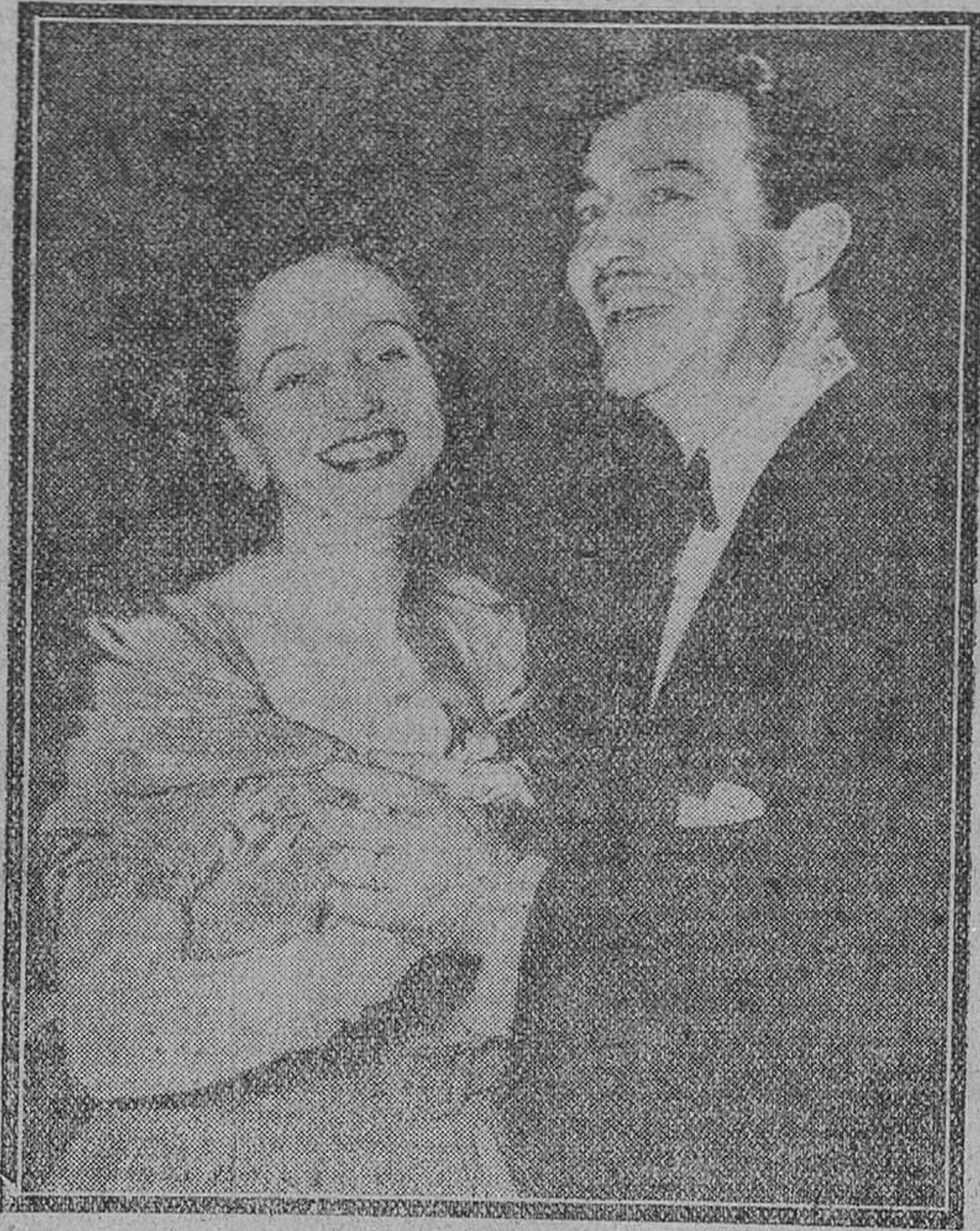
Miss Margaret Truman, hija del presidente de los Estados Unidos, ha sido sorprendida por el fotógrafo bailando con el famoso actor de la pantalla, Robert Taylor, en una reciente fiesta celebrada con fines benéficos y en la que la señorita Truman --que posee una cálida y bien timbrada voz-- interpretó --con éxito, naturalmente-- varias canciones.