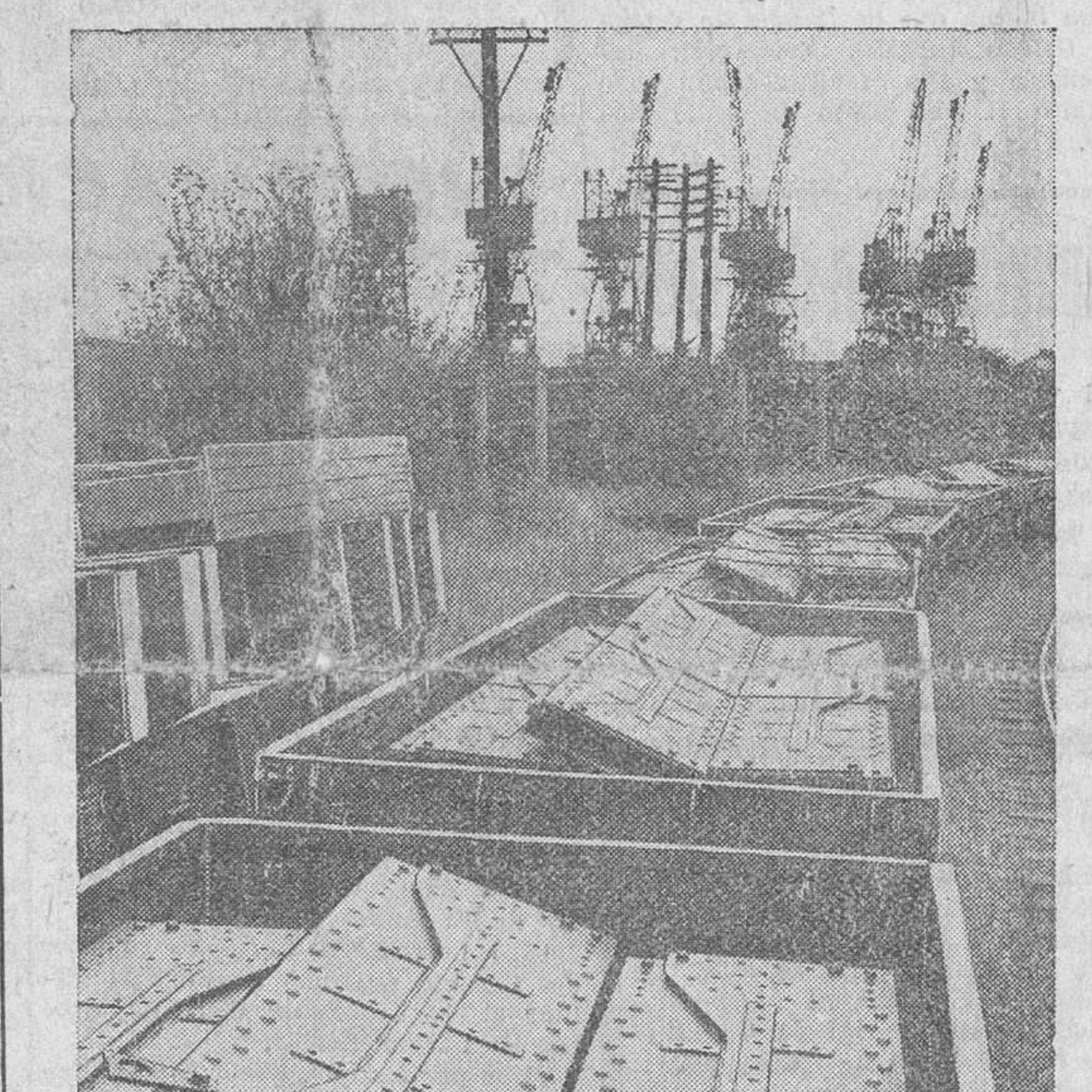
Los primeros materiales que envía la U. N. R. R. A. a China, se embarcan en el puerto inglés de Tilburg. Se trata de piezas prefabricadas para la construcción de puentes