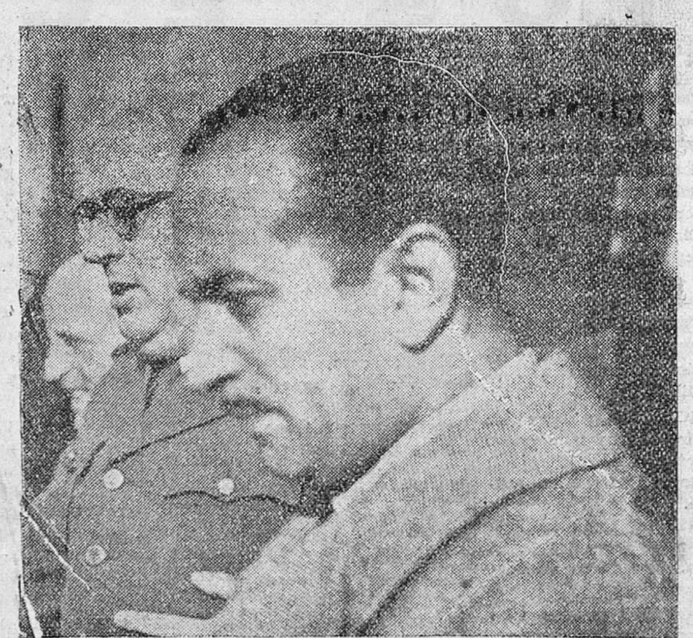
EL CAPITAN GENERAL, EL GOBERNADOR CIVIL Y ALCALDE DE LA CIUDAD, PRESENCIAN, DESDE EL BALCON DE CAPITANIA, EL MAGNO ESPECTACULO DEL GENTIO CONGREGADO ANTE EL HISTORICO EDIFICIO, PARA ACLAMAR A FRANCO EN IMPRESIONANTE MANIFESTACION PATRIOTICA