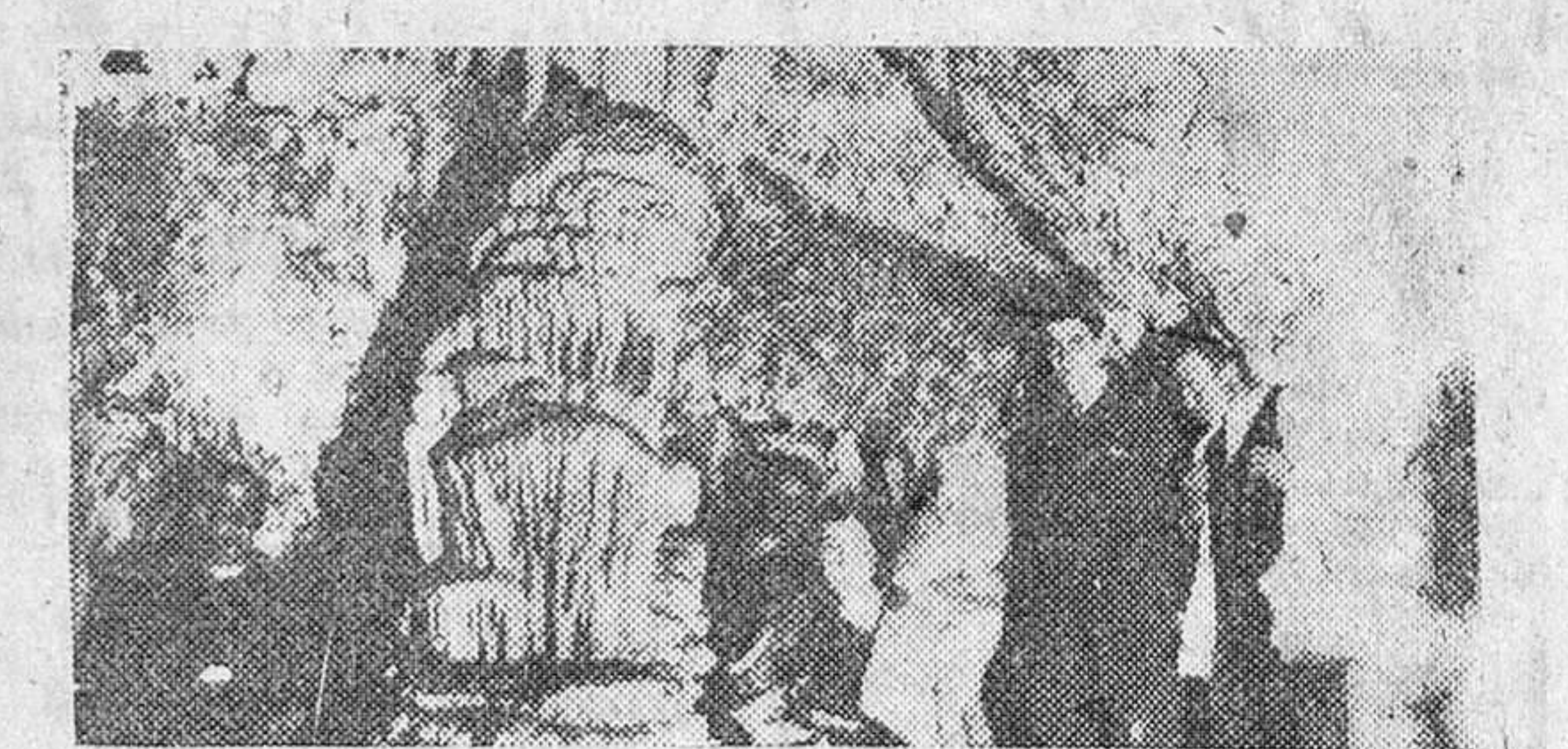
Reproducimos hoy el interior de la cueva "Los muñecos" situada a corta distancia de Almadén y que está siendo objeto de estudio tanto por su interés arqueológico, como porque en sus inmediaciones pasa el río "Ojalera" (hoja de oro) que arrastra arenas auríferas, y en cuyo márgenes han sido denunciadas varias pertenencias mineras de este metal