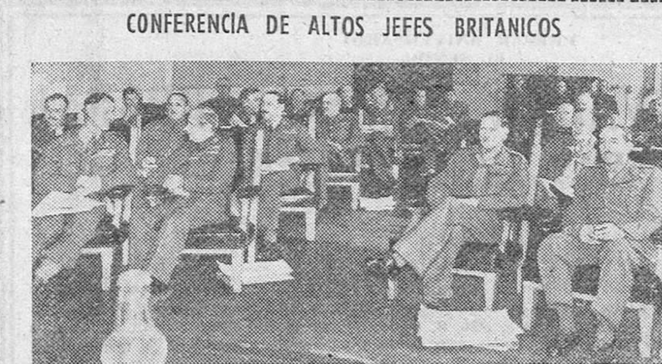
CONFERENCIA DE ALTOS JEFES BRITANICOS. El jefe del Estado Mayor imperial británico, Lord Alanbrooke, celebró recientemente en Camberley, una conferencia con los comandantes en jefe ingleses. Esta fotografía está tomada durante la reunión.

El jefe de la misión, almirante Moreno, recibió la bienvenida del embajador de España en la Argentina, conde de Bulnes. En nombre del presidente electo, Perón, saludó a la misión de España el coronel Silva.