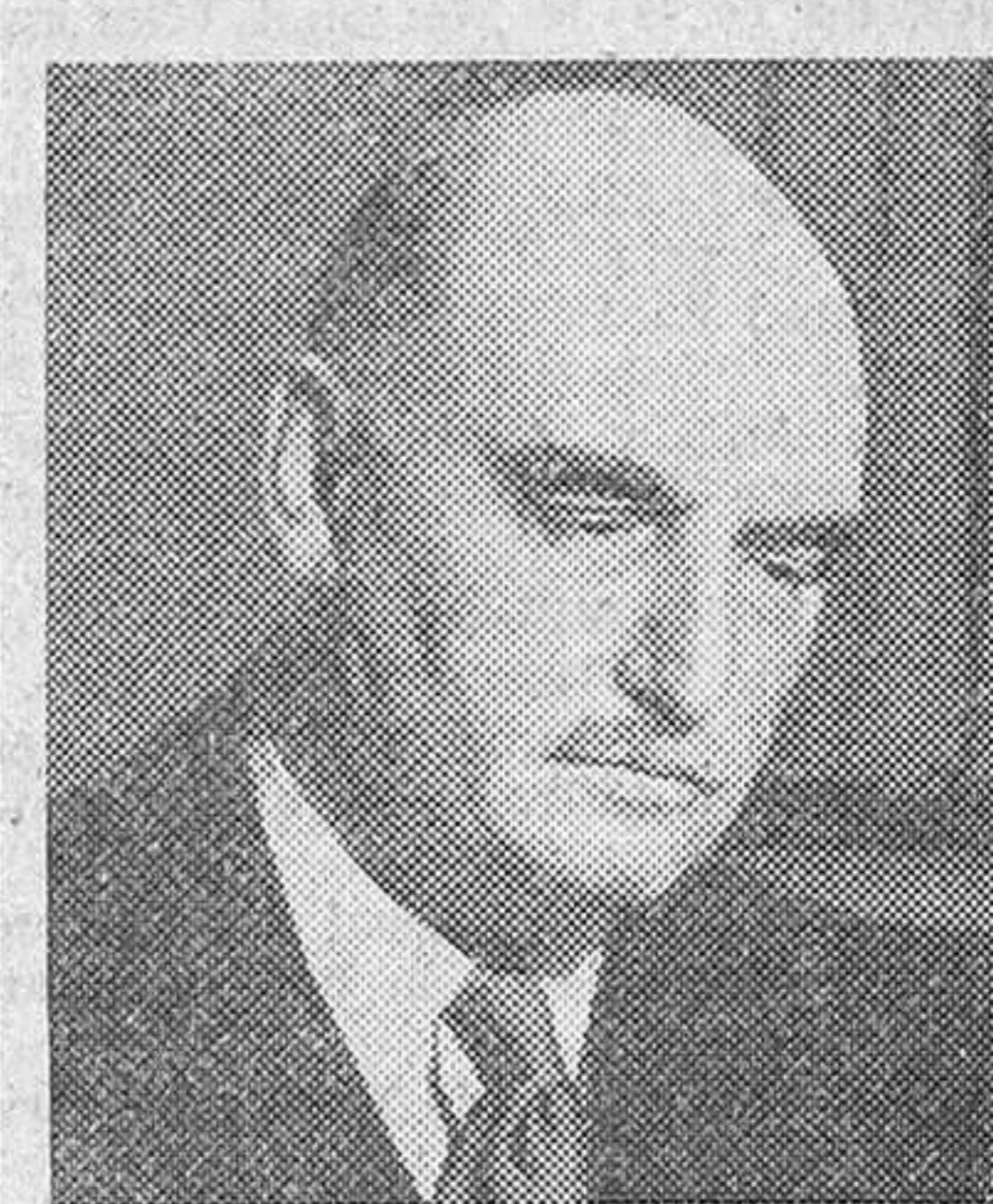
Sir Arthur Steel, vicepresidente del Consejo Nacional británico del carbón