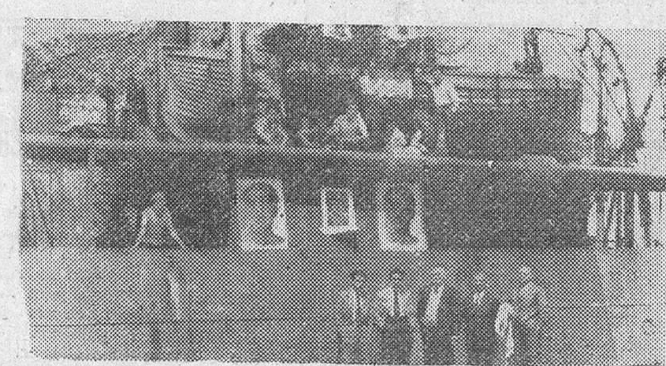
El vapor inglés «Kalie», atracado en el puerto de Gijón que fue engalanado con los retratos del jefe del Estado