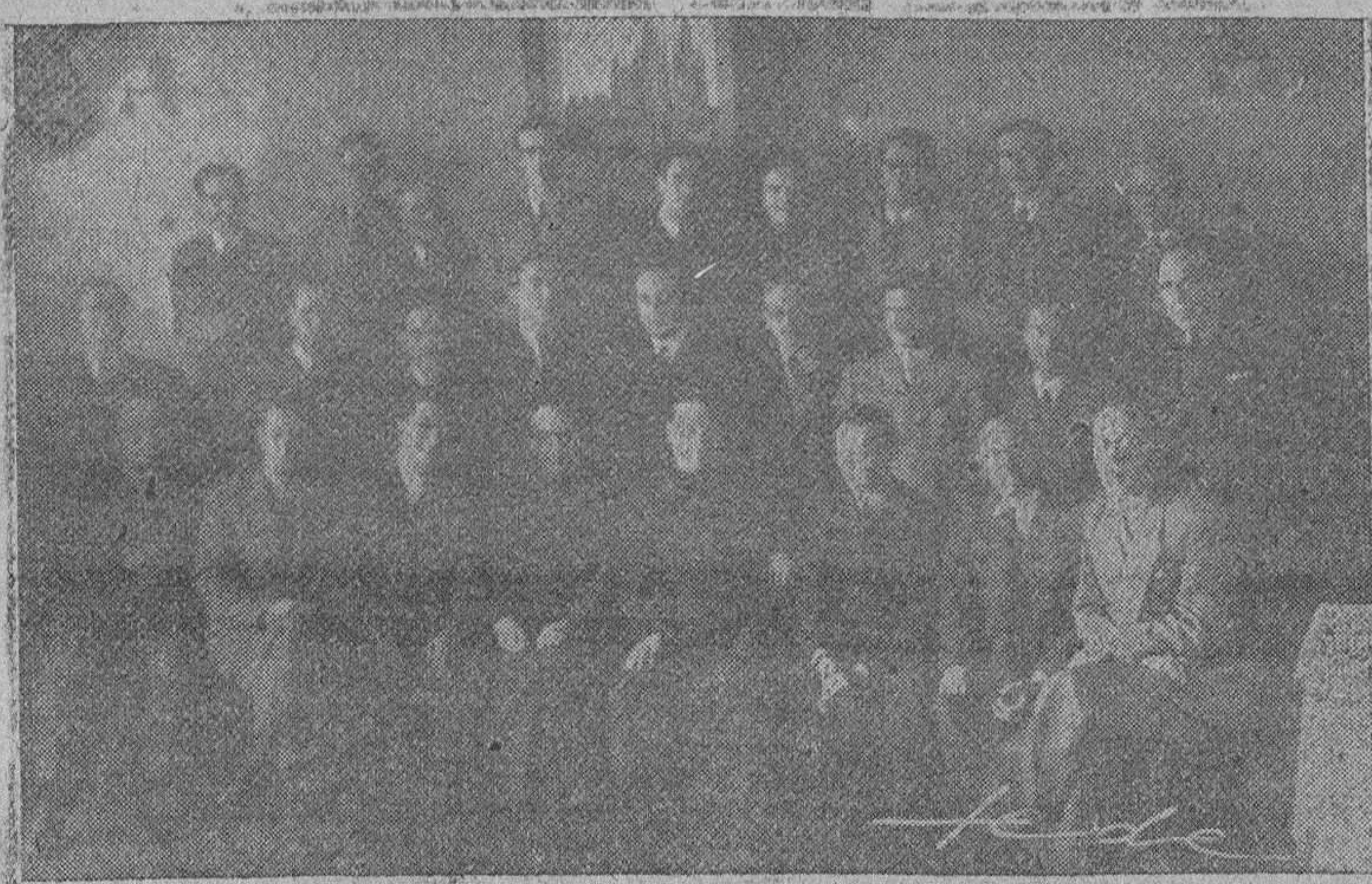
Los periodistas iniciaron el ombligo último los actos conmemorativos de la festividad de San Francisco de Sales, su Patrón. He aquí la placa lograda por FEDE al concluir la comida de hermandad celebrada en Burgos

Existe la posibilidad de enviar un cohete a la Luna y que vuelva al punto de partida