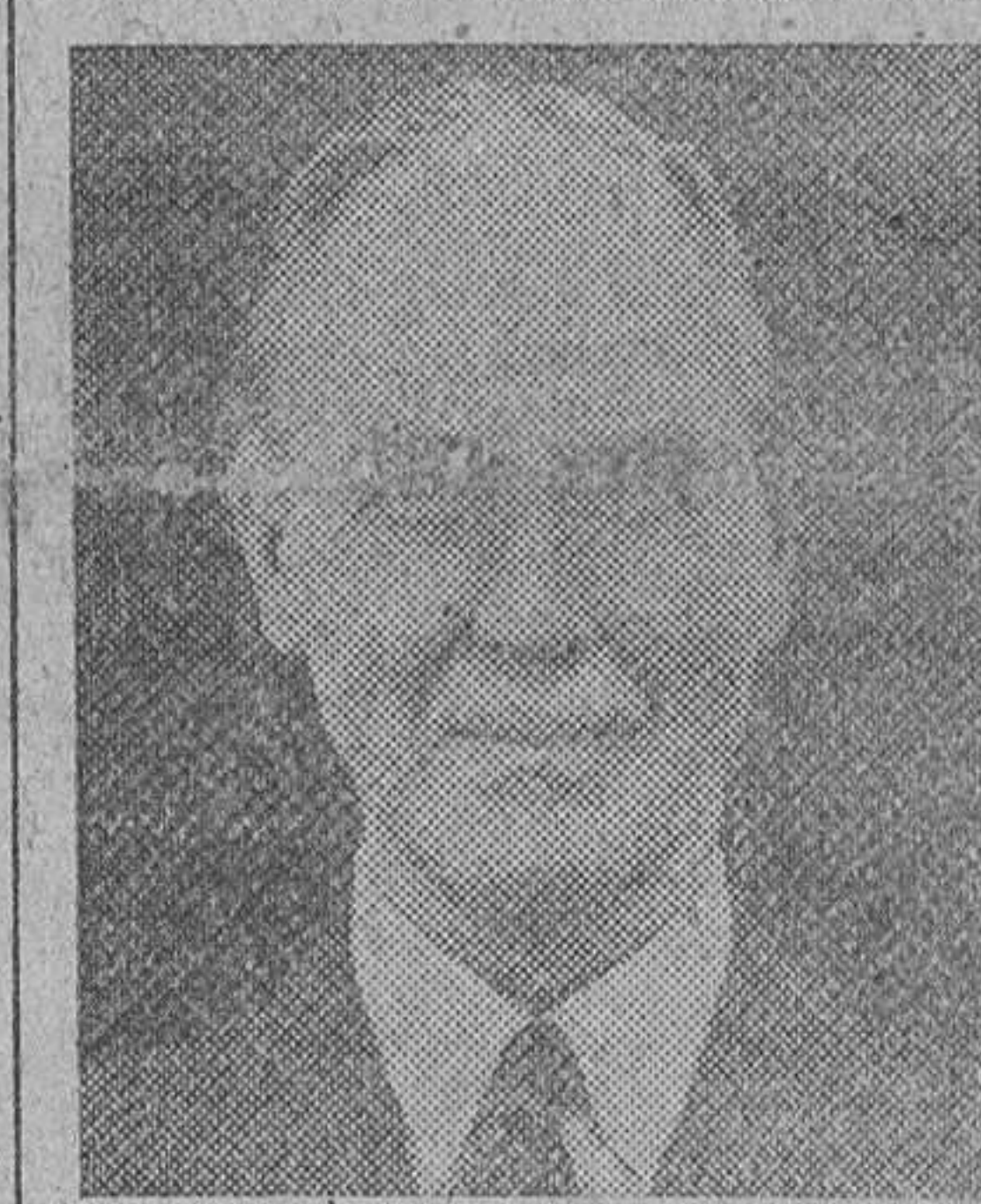
Arriba, el almirante Lord Louis Mountbatten, comandante supremo aliado en el Suroeste de Asia. Abajo, el teniente general Sir Alan Cunningham, que ha sucedido al mariscal de campo, Lord Gort, como Alto comisario en Palestina y Transjordania.

—La impresión general en el extranjero, cierta o equivocada, es que se ha realizado muy poco en el camino de una reforma política en España. Sería muy útil si V. E. quisiera aclarar este concepto.