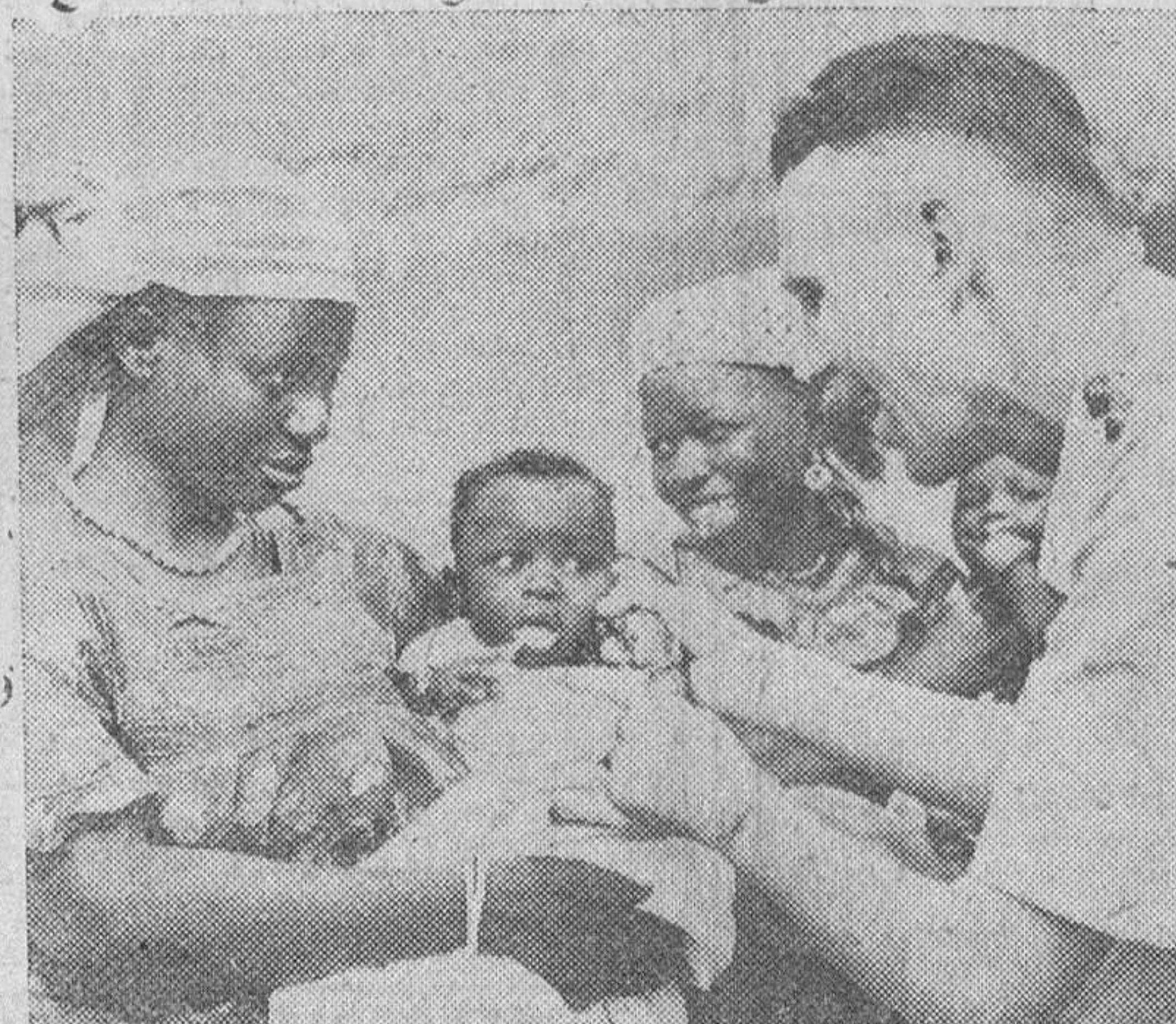
Los hijos de los soldados africanos que han combatido junto a las tropas aliadas durante la pasada guerra, reciben asistencia médica gratuita de los facultativos ingleses, como nos muestra la foto