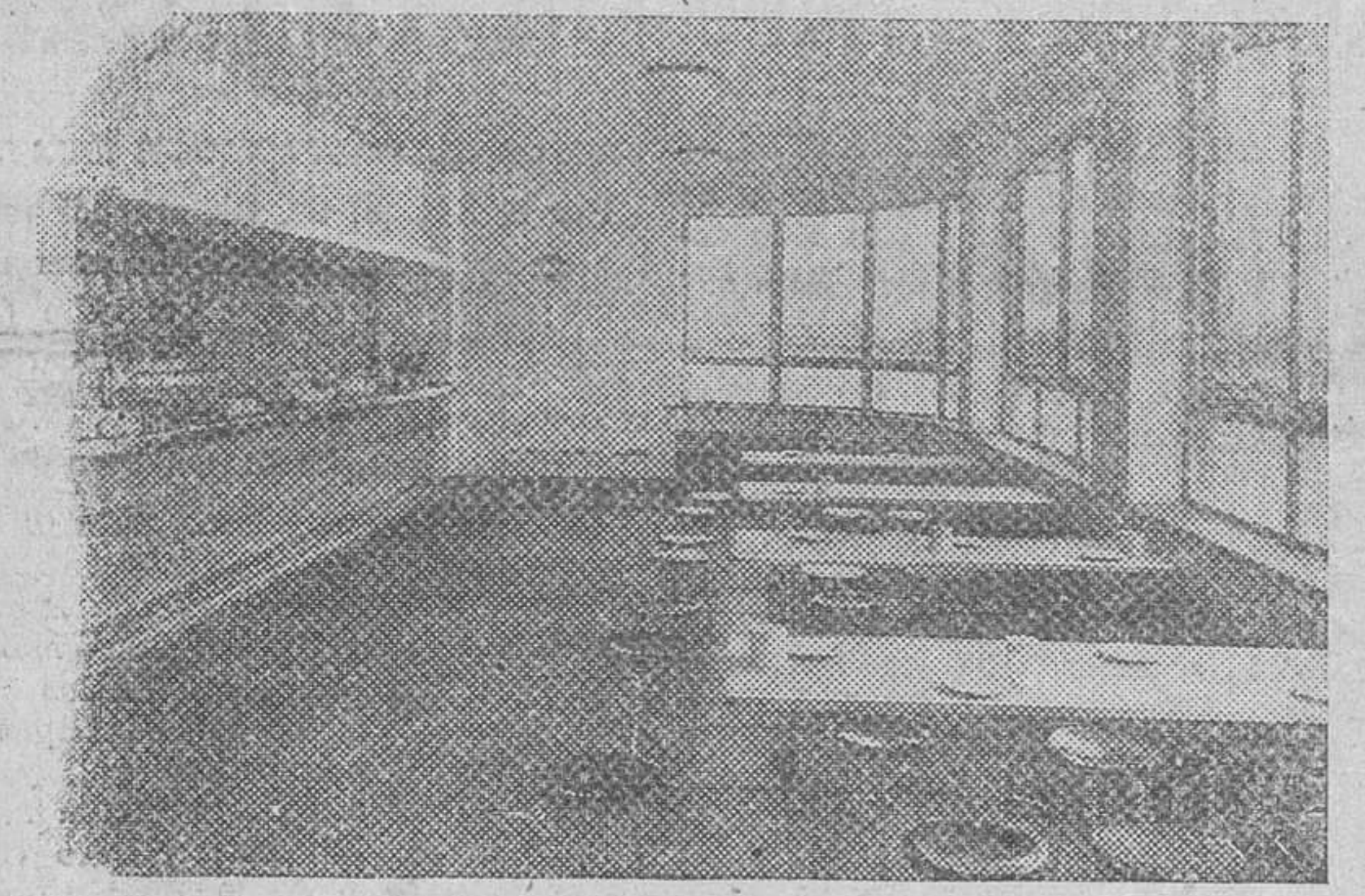
Vista de conjunto que ofrece la amplia sala de una cantina instalada junto a una de las minas de carbón de Nottinghamshire, en Inglaterra para uso de los trabajadores mineros