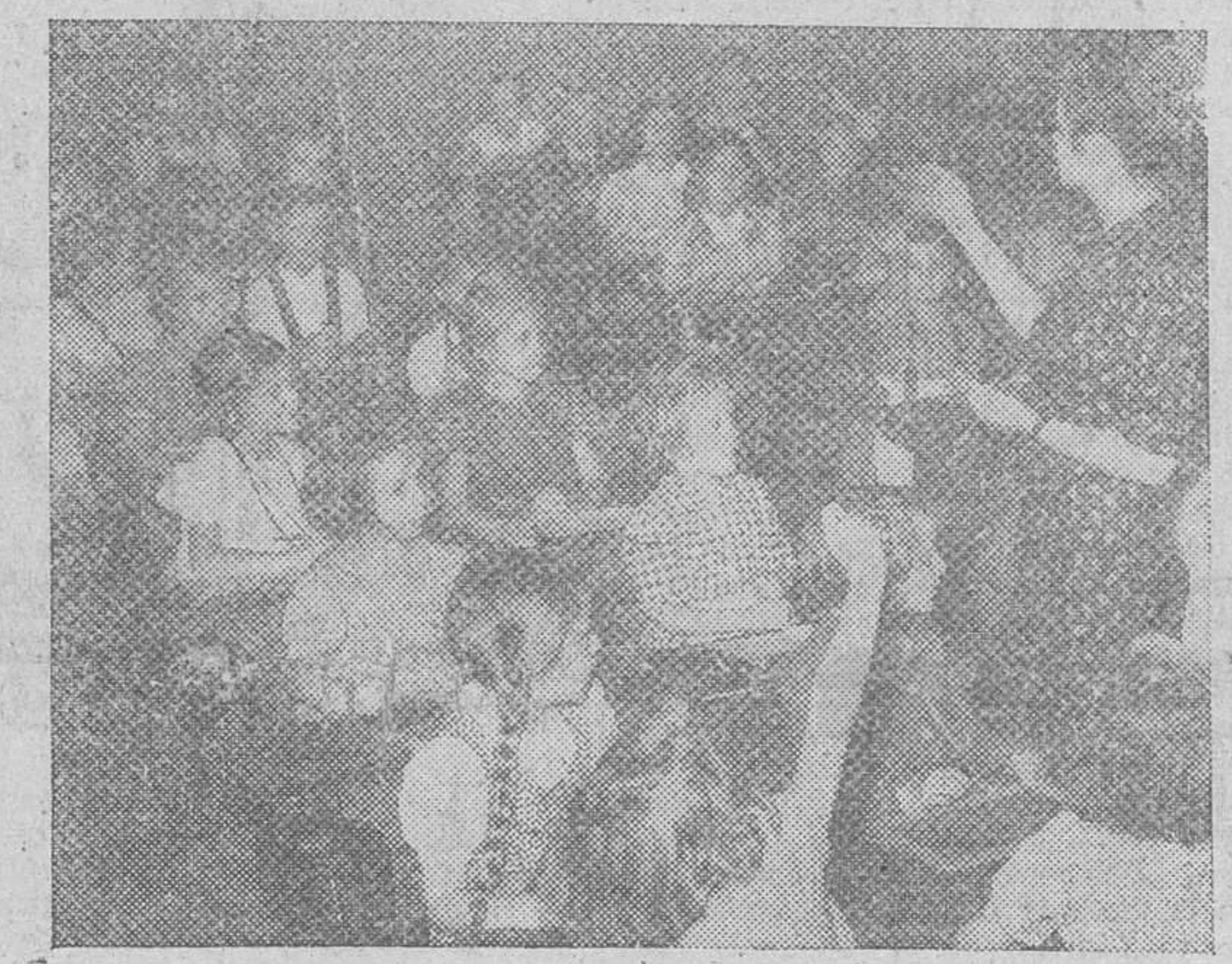
Bajo el control inglés, se han reanudado las clases para los niños alemanes, como nos presenta esta foto