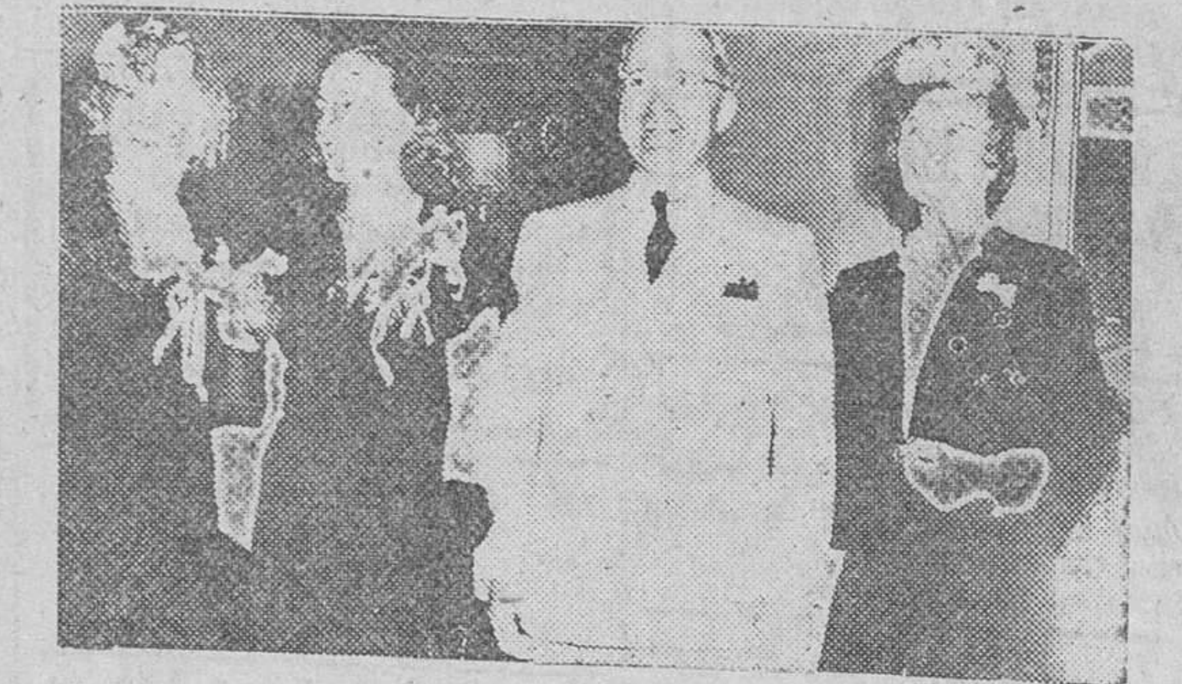
El presidente Truman, de los Estados Unidos, acompañado de su familia —su hija, su esposa y su hermana— que habitan actualmente en la Casa Blanca, residencia que antes ocupaba el presidente Roosevelt, su antecesor.