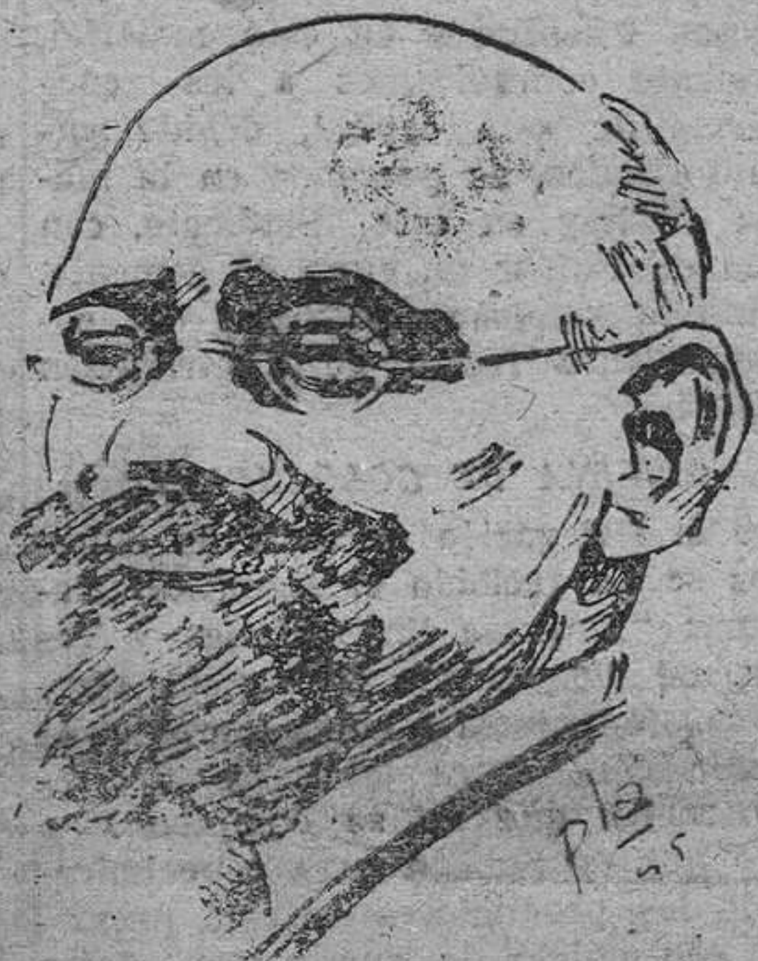
Karl Renner, jefe del Gobierno austriaco establecido por Moscú en Viena y antiguo político del Partido Social democrático.

Viena.— Ha sido concertado un acuerdo entre la Gran Bretaña, los Estados Unidos y la URSS con respecto al Gobierno austriaco de Renner.