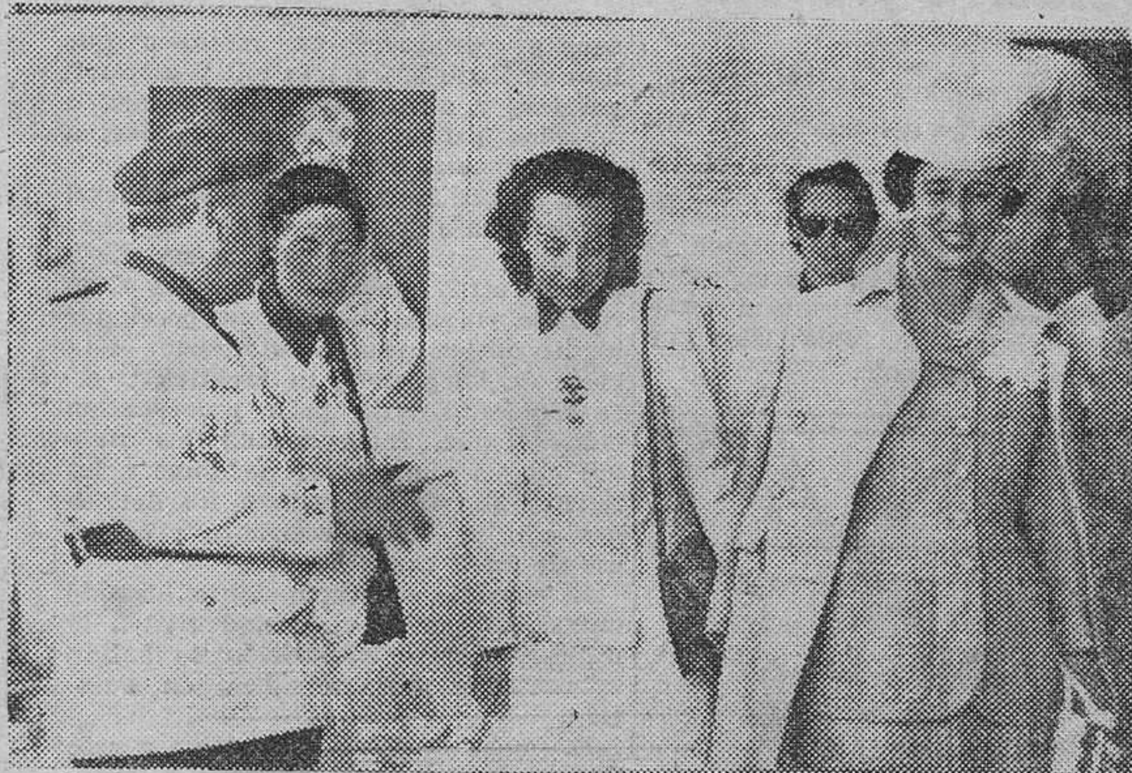
S. E. el Jefe del Estado, su señora, la delegada nacional de la Sección Femenina y otras jerarquías, presenciando la "Demostración gimnástica deportiva" de las camaradas de la Falange Femenina.