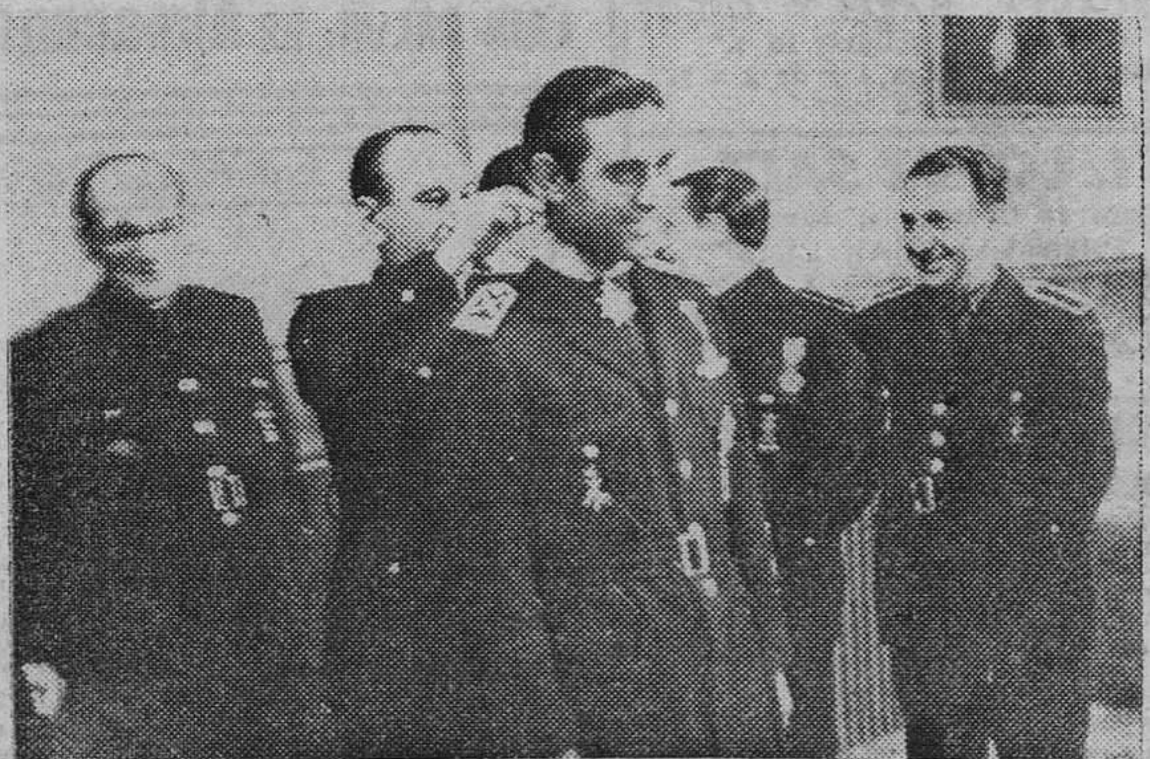
Madrid.—El ministro secretario general, ante destacadas jerarquías del Partido, impone al jefe provincial del Movimiento de Alicante, la condecoración que le ha sido otorgada por el Caudillo.