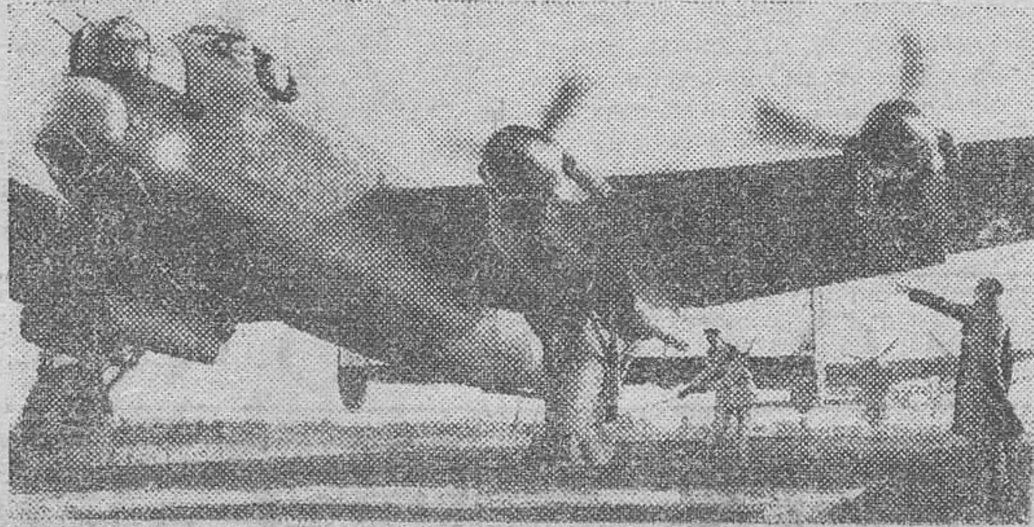
Bombarderos británicos cuatrimotores tipo "Lancaster" disponiéndose a despegar para efectuar un "raid" sobre territorio enemigo.