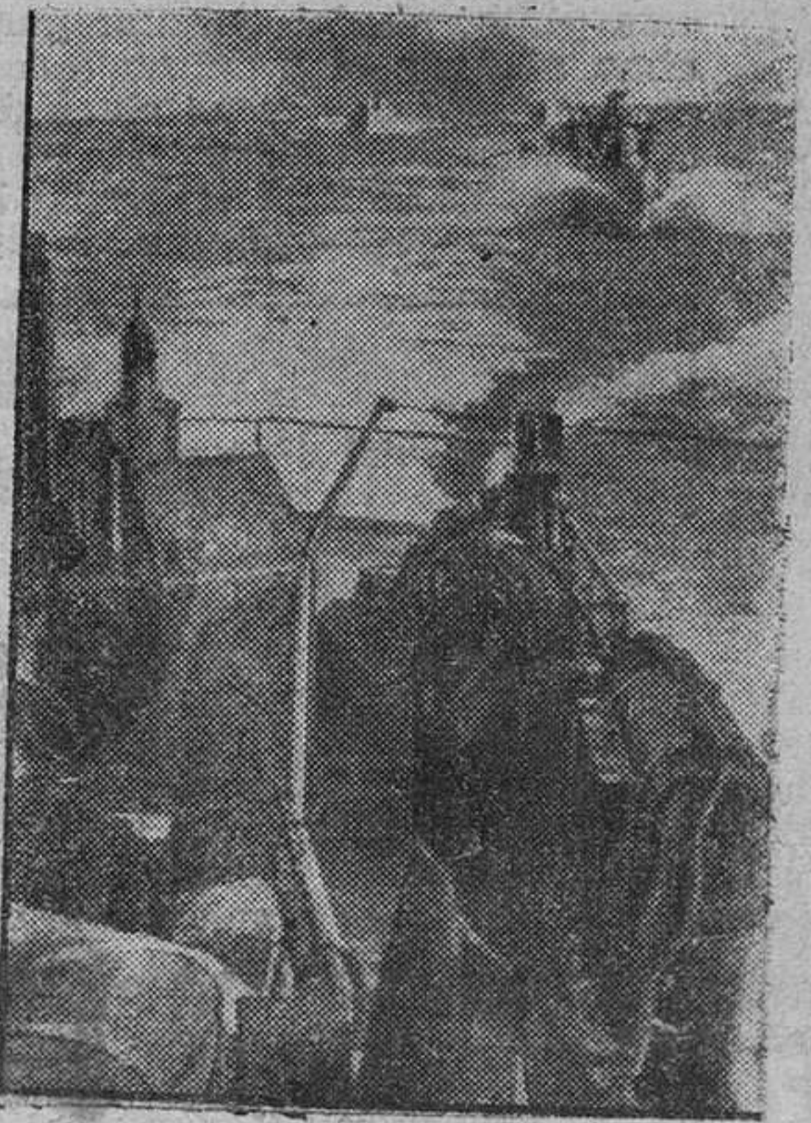
Barcos dragaminas alemanes limpian las aguas cercanas a Noruega para la mejor realización del tráfico guerrero