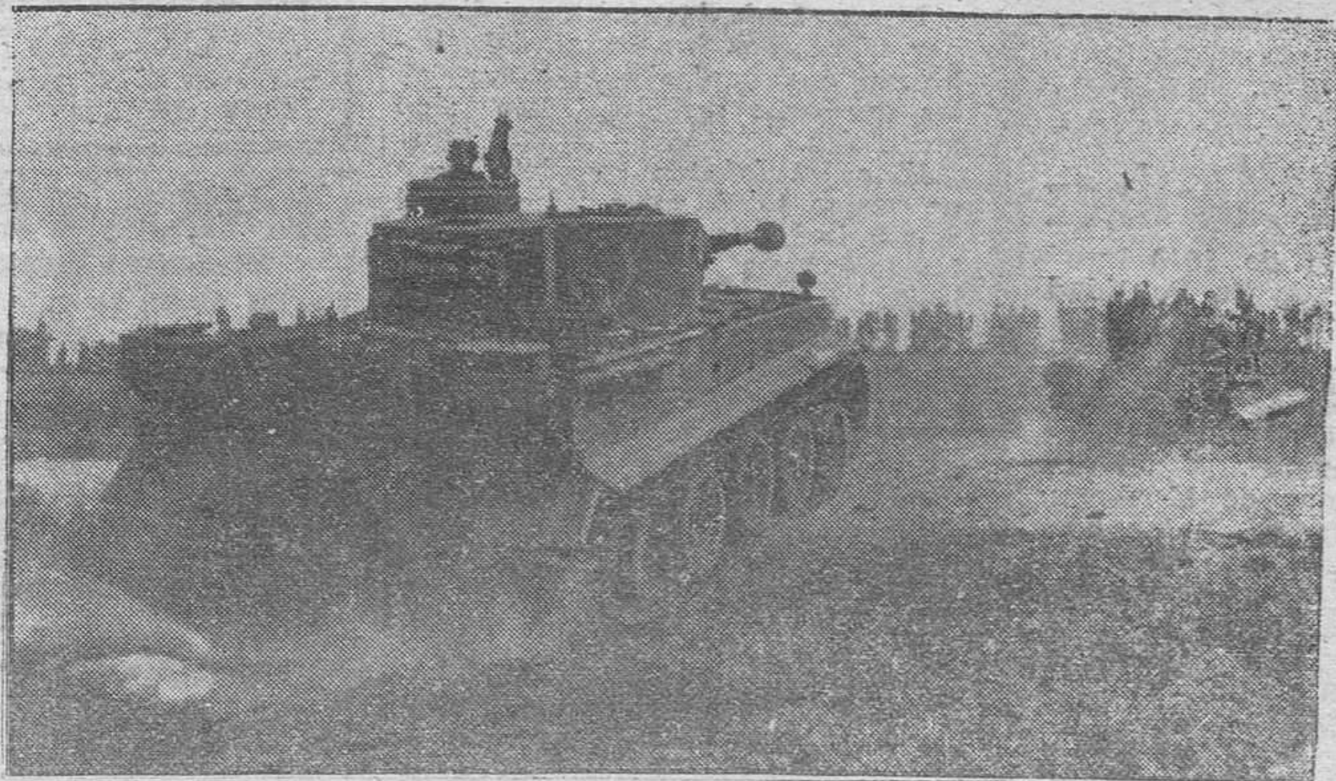
Los nuevos tanques alemanes que salen constantemente de las fábricas son sometidos a diversas pruebas de funcionamiento, como nos muestra la foto, antes de su salida para las líneas de combate