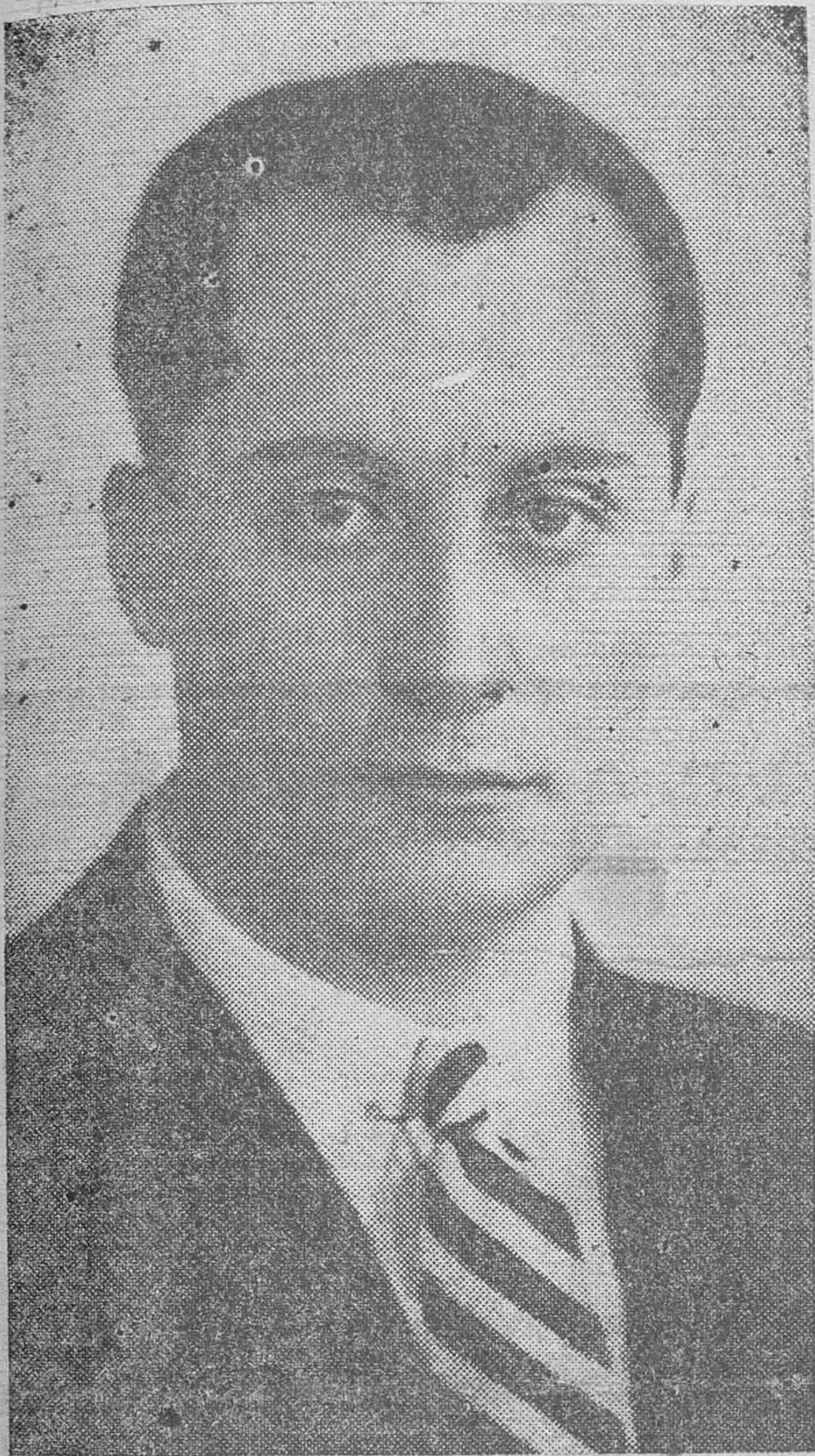
Hace seis años, JOSE ANTONIO caía para siempre, víctima del odio marxista, derramando su sangre por la Unidad, la Libertad y la Grandeza de España. Hoy, bajo el signo de Franco, la Patria, recobrada en la línea de sus históricos destinos, dedica al Fundador el más sentido de sus homenajes, con este grito, emotivo y triunfal: José Antonio, ¡Presente!

Para el político es imprescindible la precisión de partir de la más cruda y descarnada realidad de los acontecimientos. Este no supone, en modo alguno, el abrazarse al oportunismo como tímida aceleración de la posesión del mando y, menos aún, emitir como norma tática el tan traído y llevado "posibilismo". Si José Antonio amarró seriamente los cabos de la realidad española, al alpar la voz gallarda y entera de la fundación de la Falange, no lo hizo para valerse de las circunstancias de la hora en provecho de una momentánea estrategia política. Lo hizo, precisamente, para desembarancar la conciencia empantanada de los españoles y sacar de las anécdotas cotidianas la lección desgarradora que la suicida pérdida del rumbo colectivo dictaba con sangre y fracaso en cada hora del ocaso español.