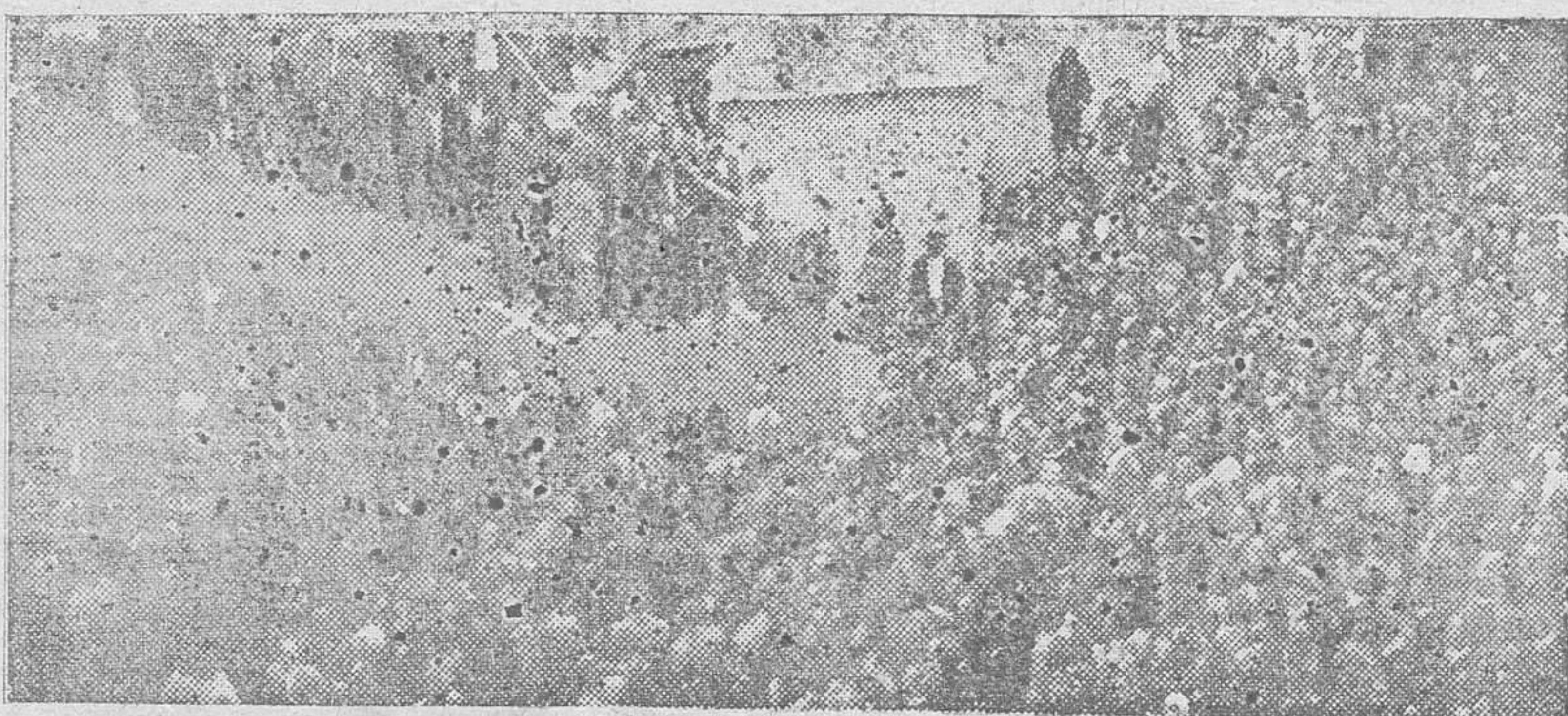
JOSÉ ANTONIO, con sus juveniles escuadras, plenas de fé, henchidas marxismo acechando a plena Puerta del Sol, aquel Octubre de 1934, ante el revolucionarismo de amor patrio, en su presa, eleva la firme entonación la verdad de España...