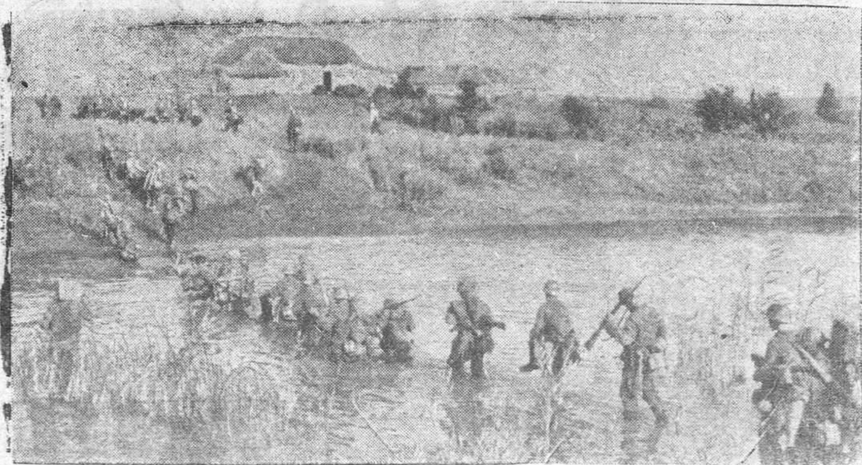
La infantería alemana en el Este, vadeando un riachuelo del Cáucaso.