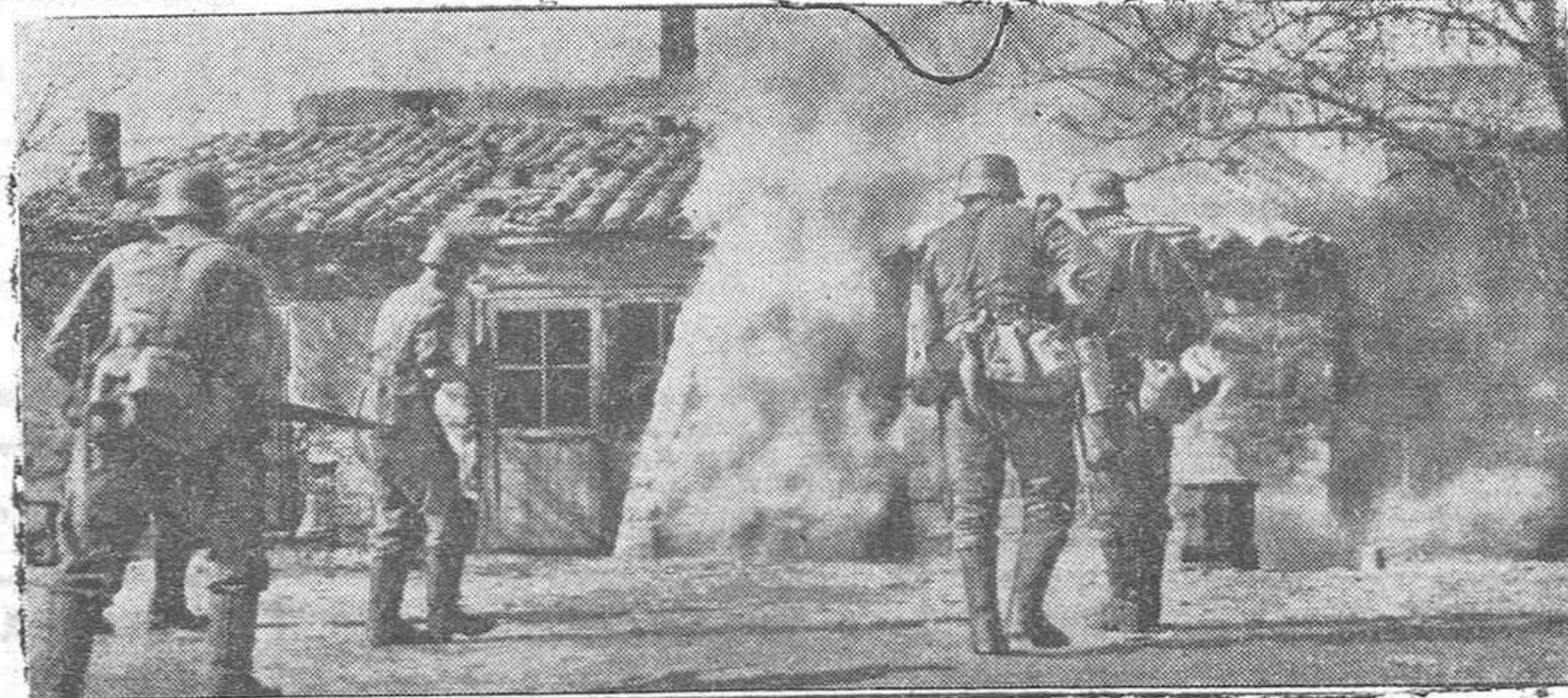
Los soldados alemanes al lanzarse al asalto de un nido de resistencia rojo en una aldea del frente del Este, en un sector de Charkow donde los alemanes han realizado avances importantes