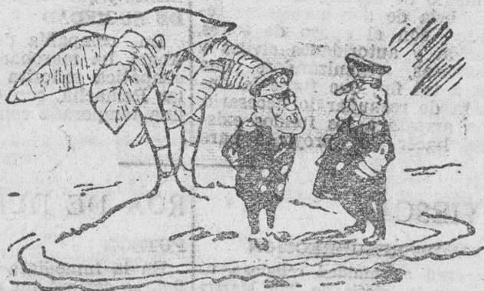
--Tenemos aún tantos buques, que los japoneses no podrán nunca hundirlos todos. --¿Son invulnerables? --No; es que ya los han hundido los italianos y los alemanes. De "La Stampa".--Turín