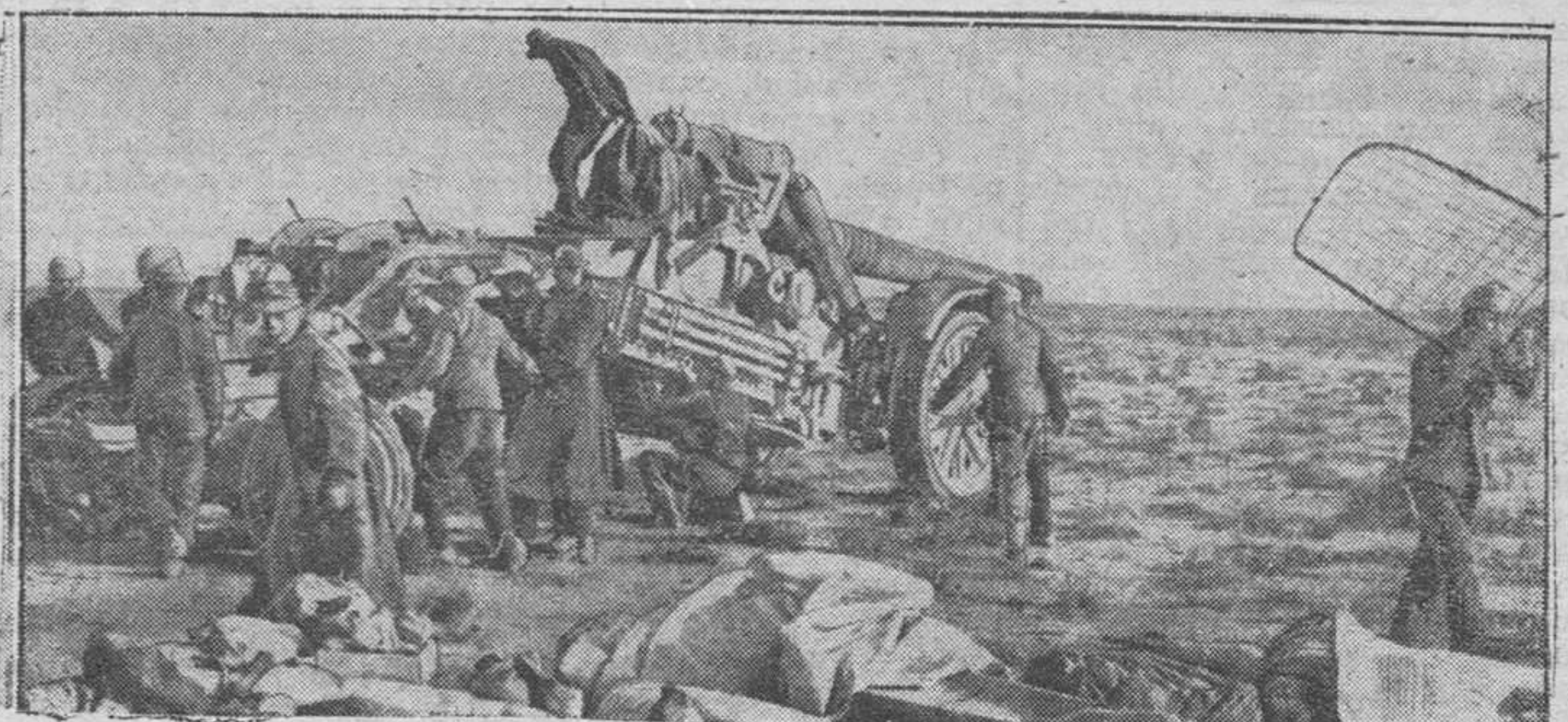
Cambio de posiciones en un punto avanzado del escenario de guerra del Norte de Africa. Ante el avance, la pieza alemana de artillería será llevada a posiciones más avanzadas