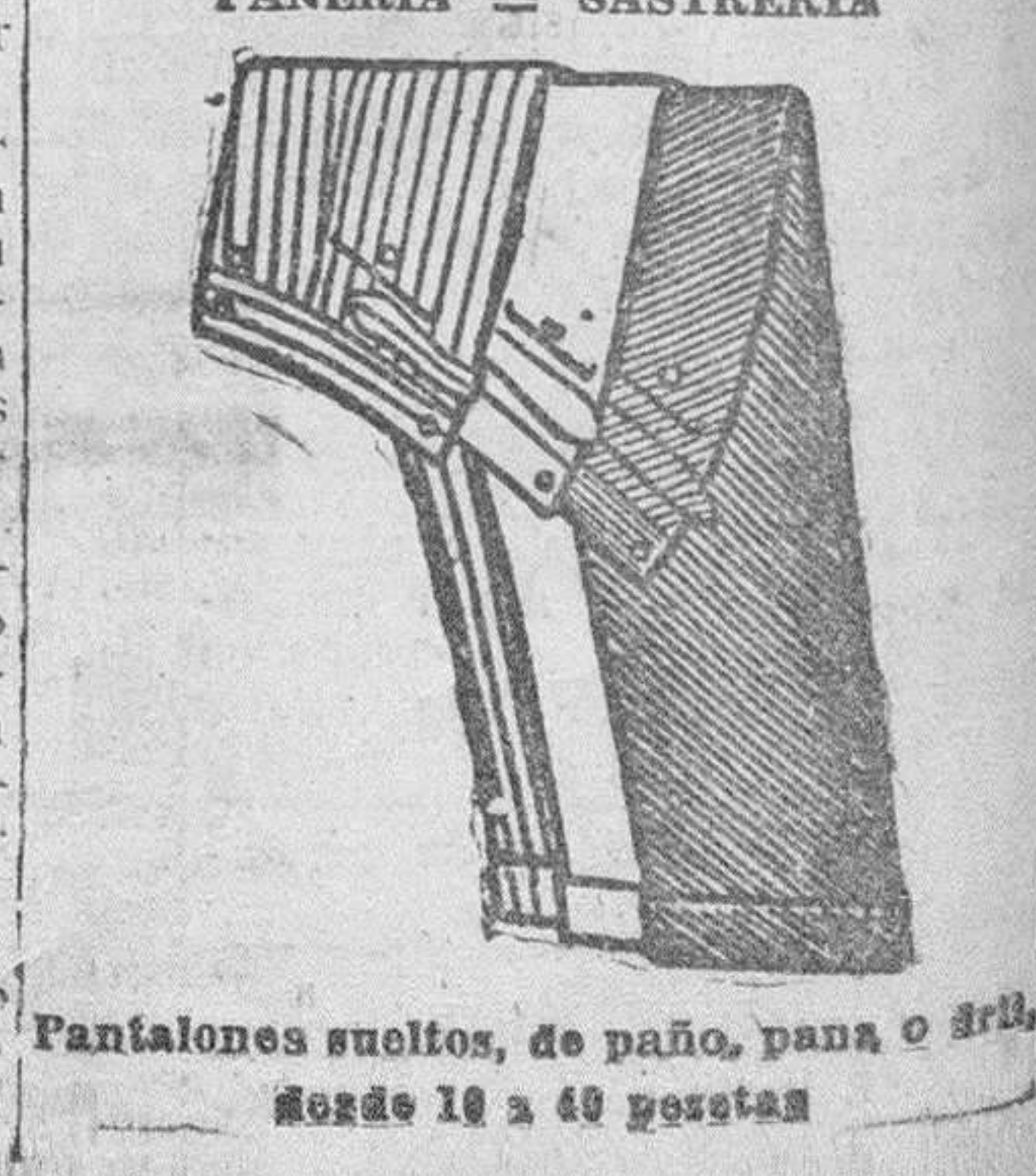
Pantalones sueltos, de paño, pana o frí. Noche 18 a 40 pesetas

Plaza Mayor, 42 Primera casa en tejidos y confecciones para caballero, señora, jóvenes y niños PANNERIA — SASTRERIA