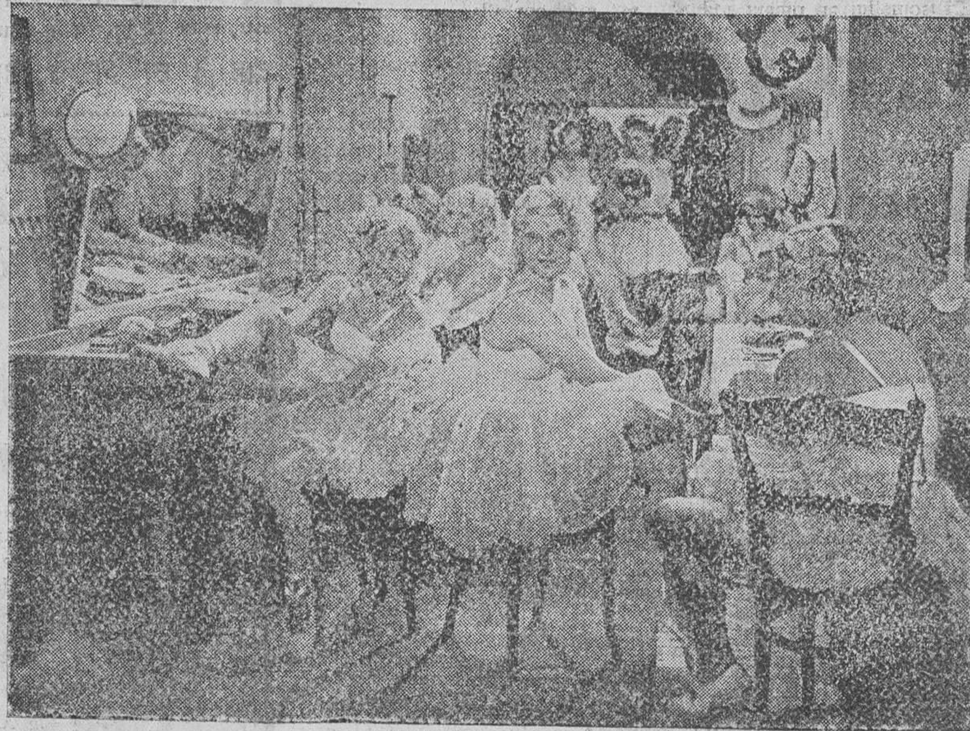
Una escena del magnífico film alemán ROSAS DEL SUR, distribuido por la entidad valenciana CIFESA