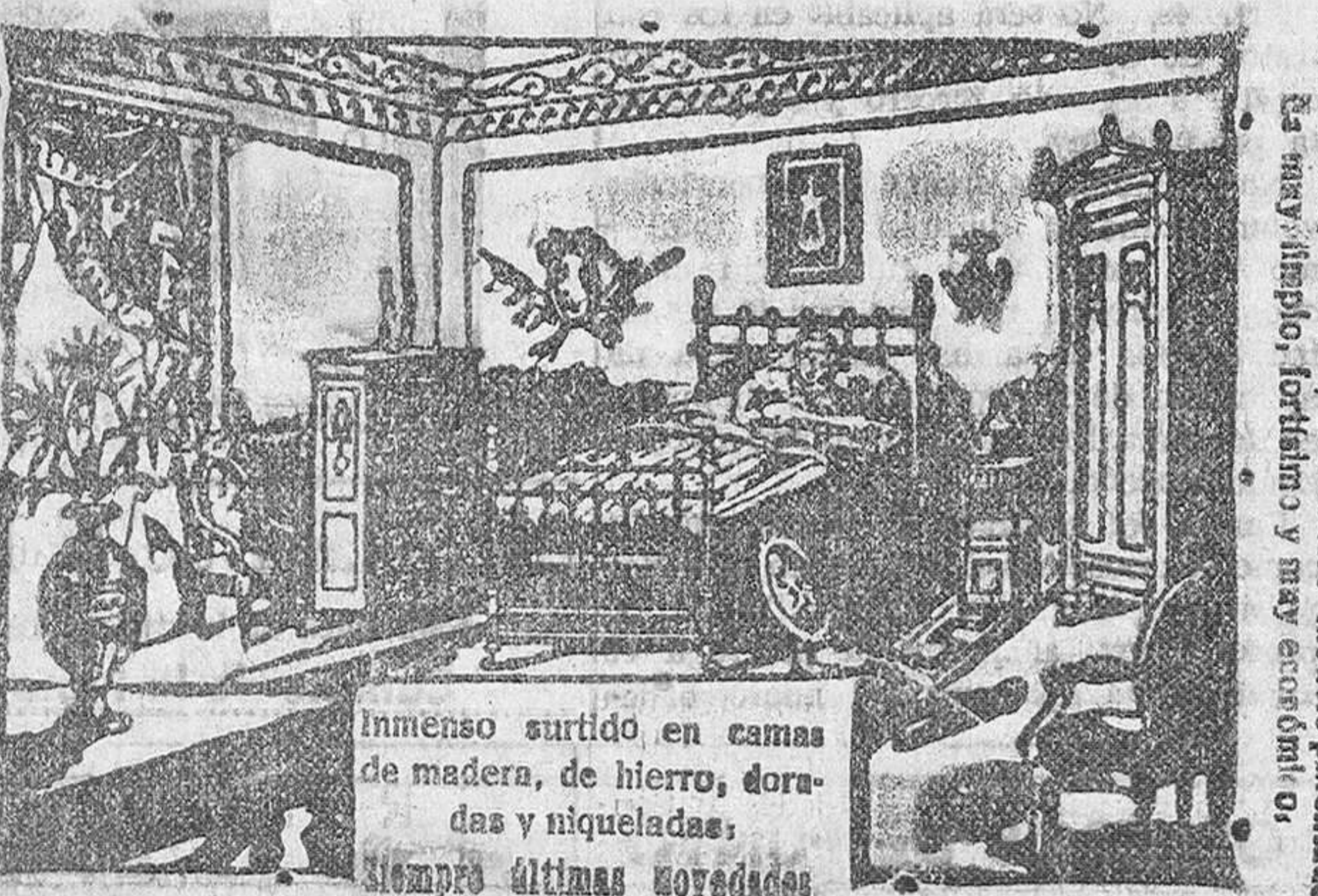
Inmense surtido en camas de madera, de hierro, doradas y niqueladas. Siempre últimas novedades.

¿Quiero comprar camas y muebles de toda confianza a precios baratísimos? Visite la Gran Bretaña en Burgos