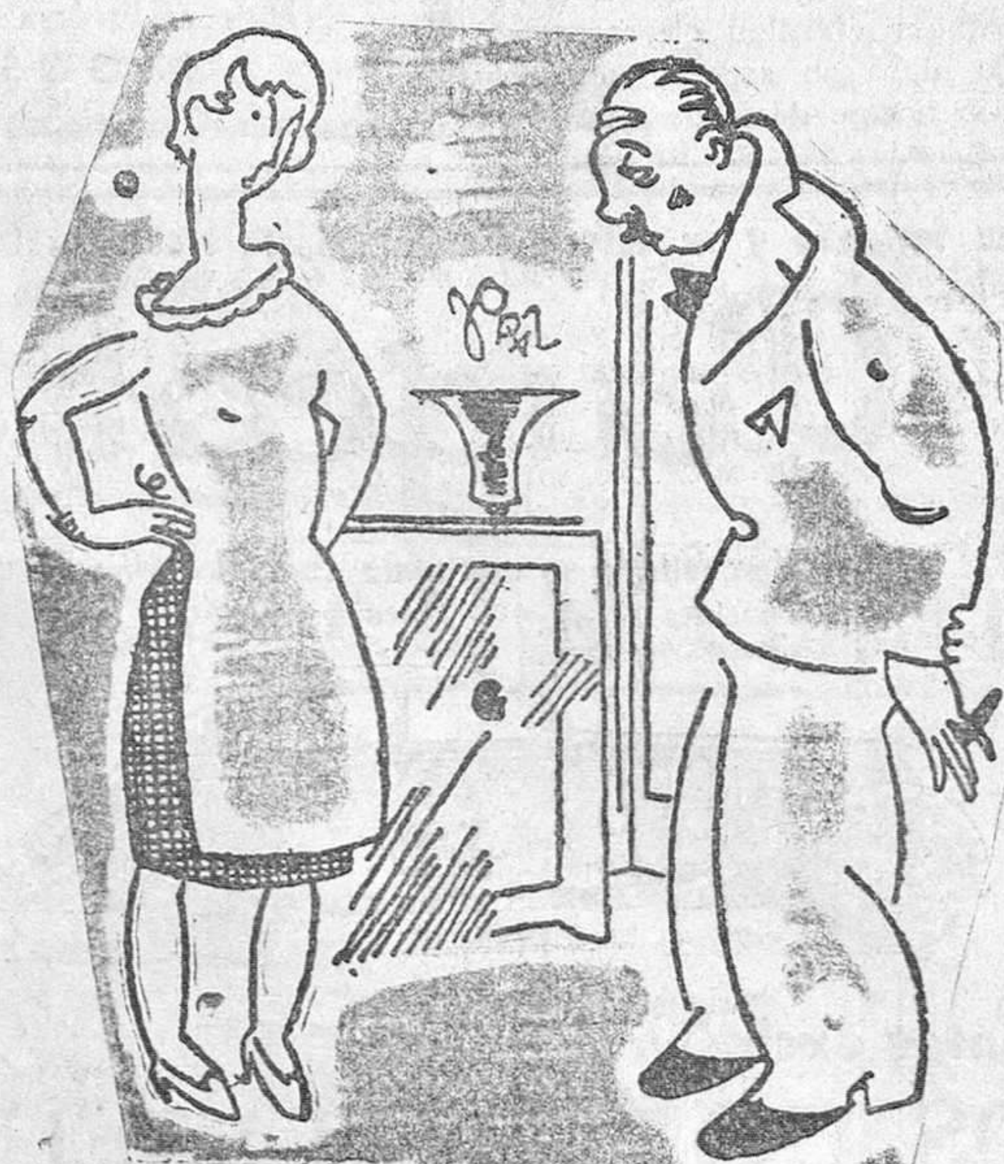
—¿Le parece a V. bien? ¿Meter en casa a un desconocido? —No pase V. cuidado, señorito. El que estaba conmigo era un guardia de asalto.