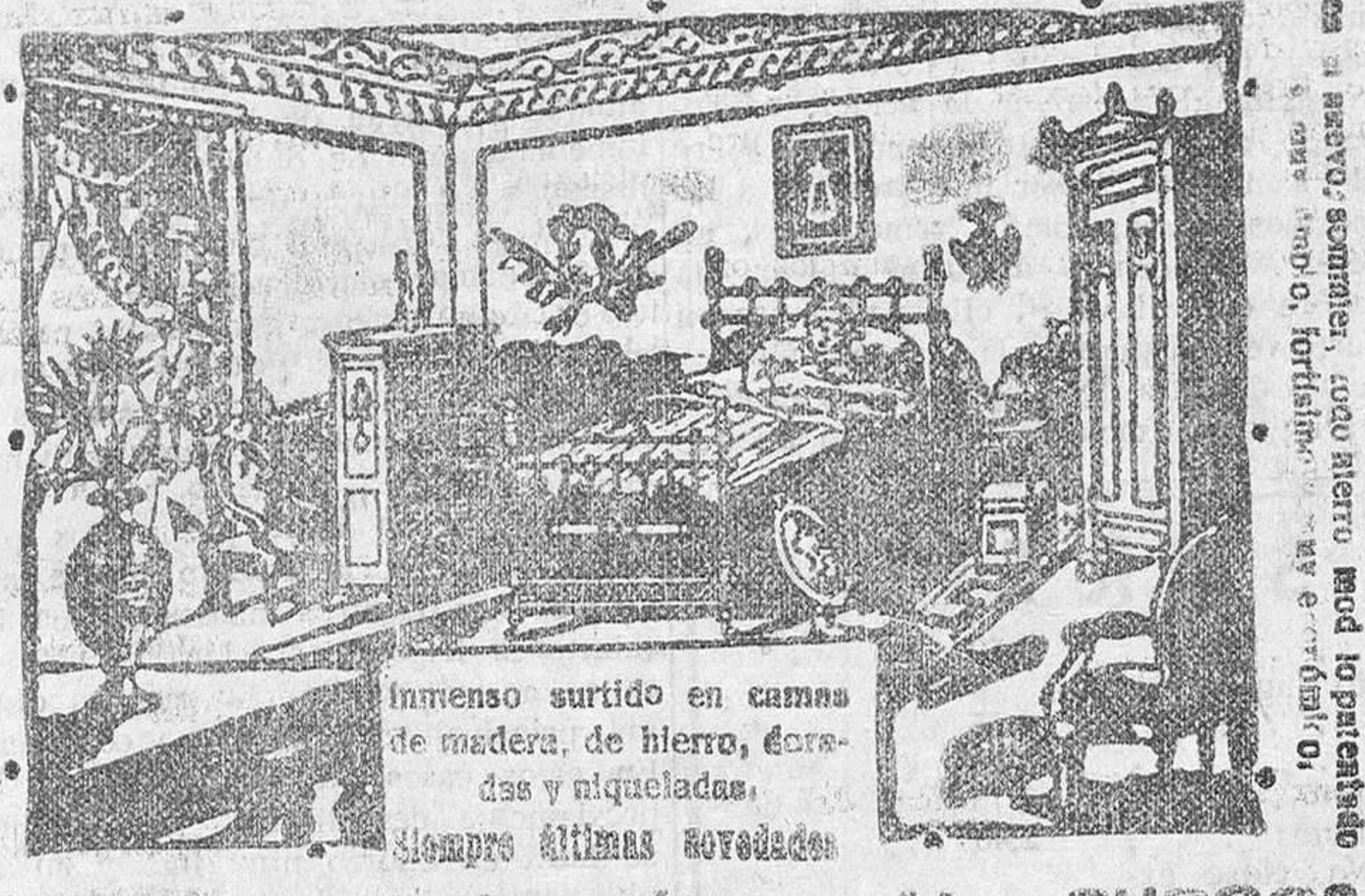
Imenso surtido en camas de madera, de hierro, forjadas y niqueladas. Siempre últimas novedades. Calle de Victoria, número 14, BURGOS En esta Casa se vende el comercio "Humano"

¿Quiere comprar camas y muebles de su confianza a precios baratísimos? Gran Bretaña