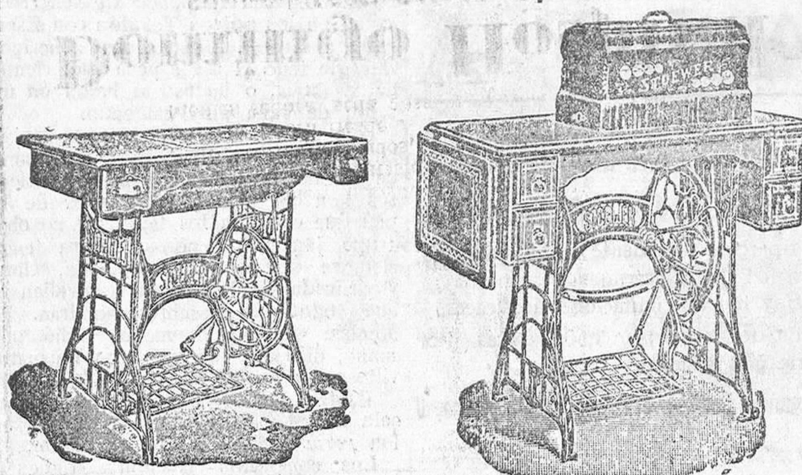
Todos los modelos de mano y pie. — Garantizadas por 10 años Plisados, vainicas, festones, punto incrustación, punto guante Se arreglan puntos de medias