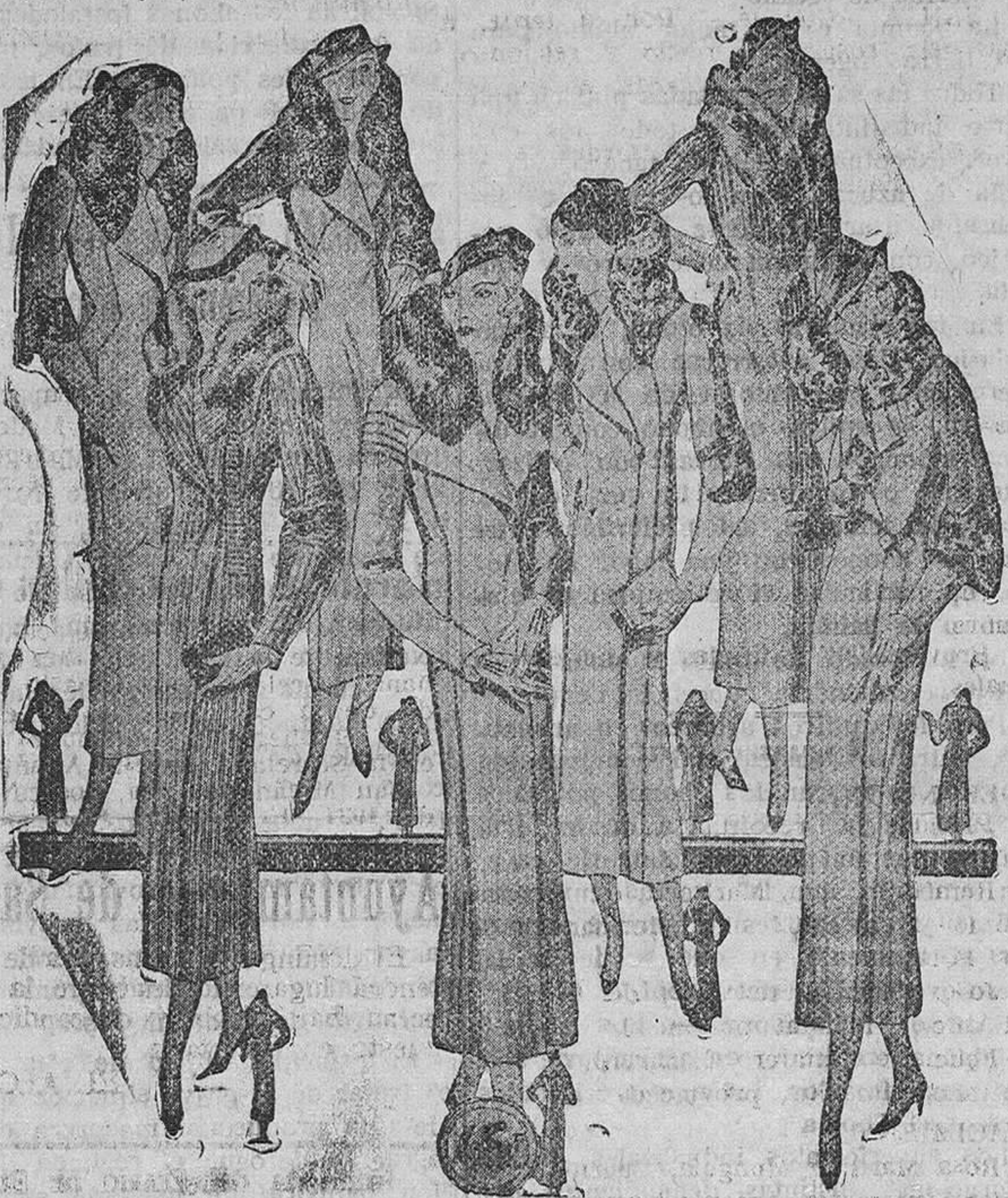
Abrigos para señora, modelos novedad, corte perfecto y confección esmerada a 26, 30, 35, 40, 50, 60, 70 y 80 pesetas.

Plaza Mayor, 42, Lala-Calvo, 9 y 11.-Sucursal: Plaza Mayor, 6, Burgos