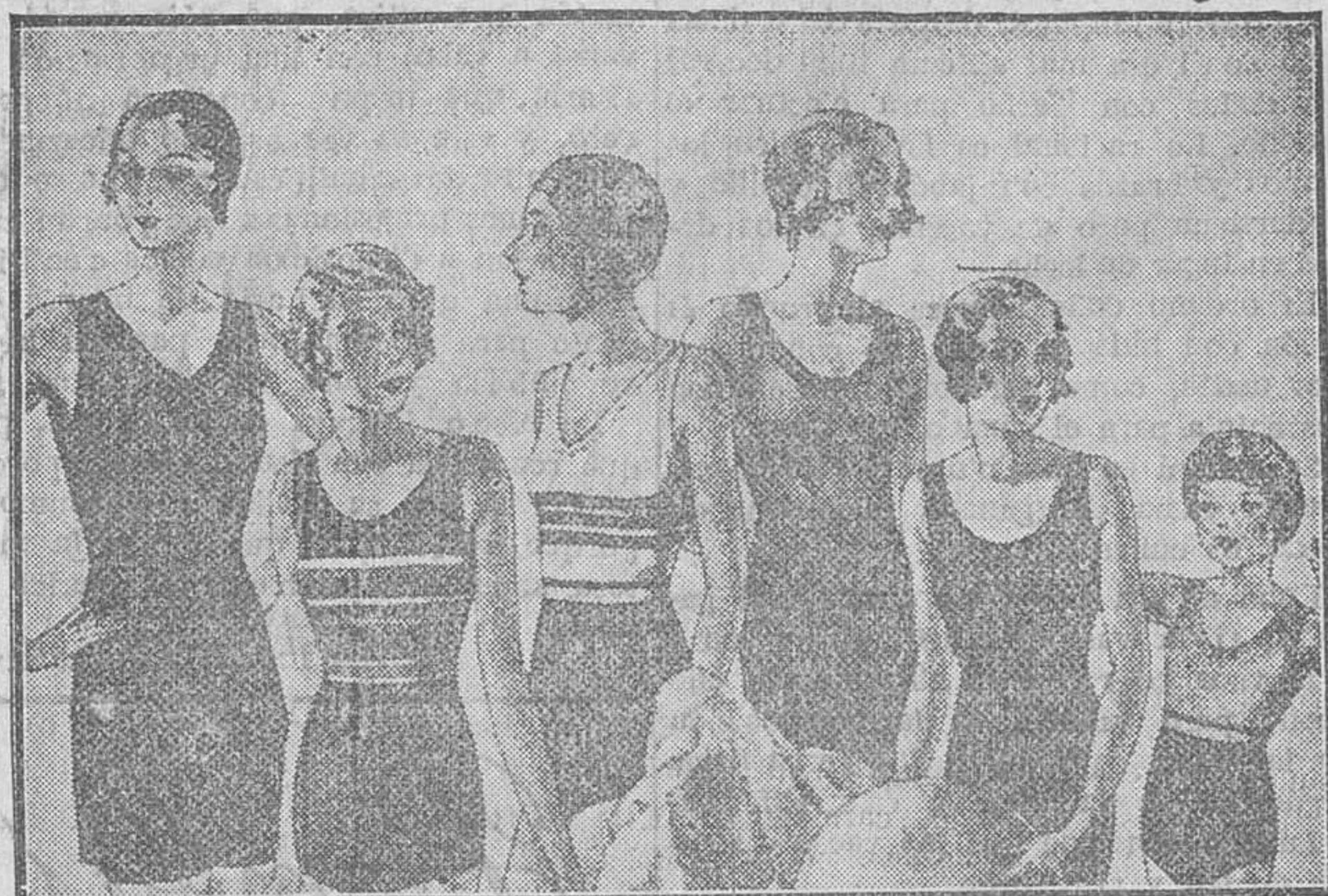
Trejes de baño, diversidad de modelos, en algodón y lana, a pesetas 3'50, 4, 5, 6, 8, 10 y 15