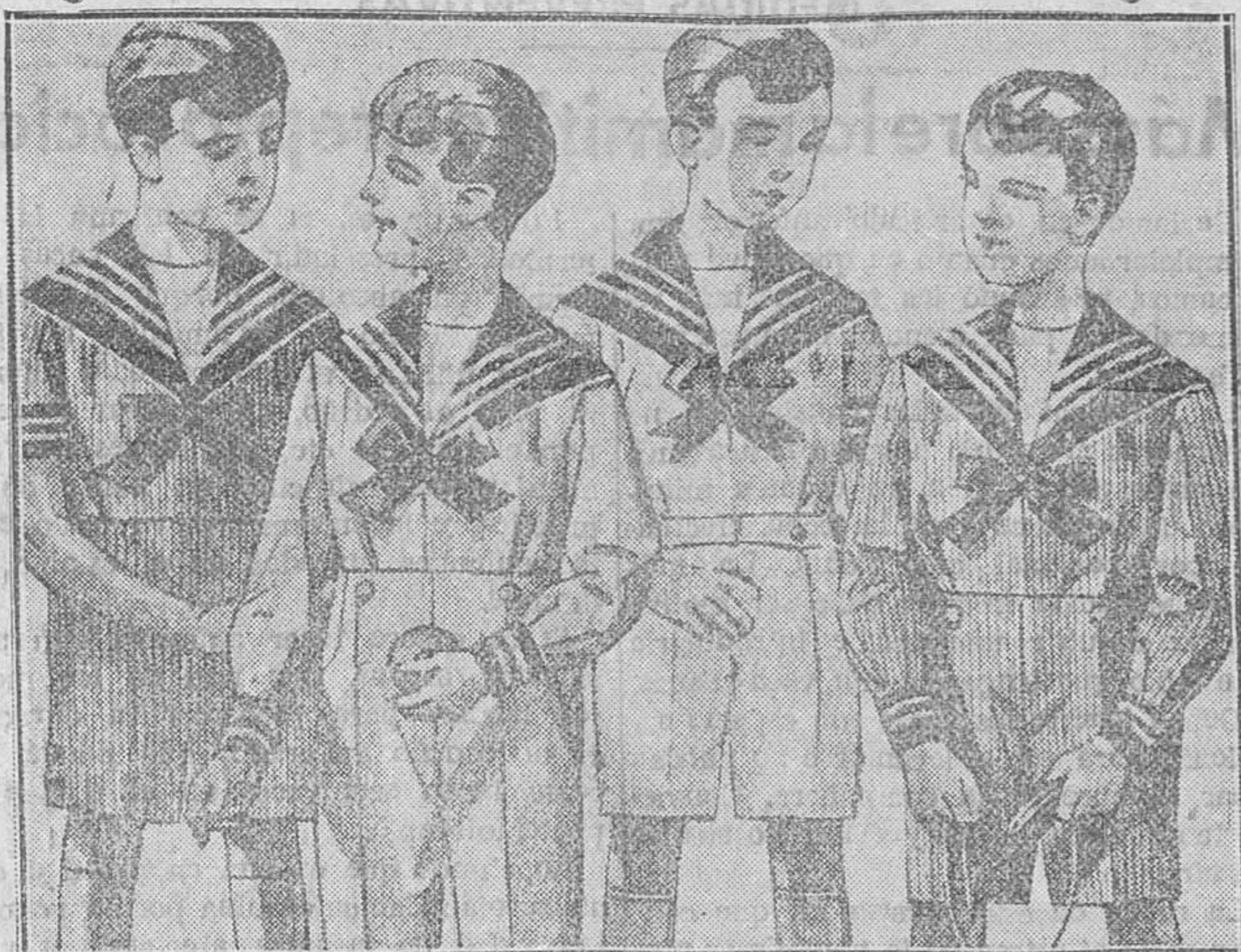
Trejes de drill mil rnyas - Todas las edades - Desde 14 a 25 pesetas Sección especial a la medida

Primera casa en tejidos y confecciones para caballero, señora, jóvenes y niños PAÑERIAS - SASTRERIAS - CALZADOS SEGARRA Plaza Mayor, 42, Laln-Calvo, 9 y 11.-Sucursal: Plaza Mayor, 8, Burgos