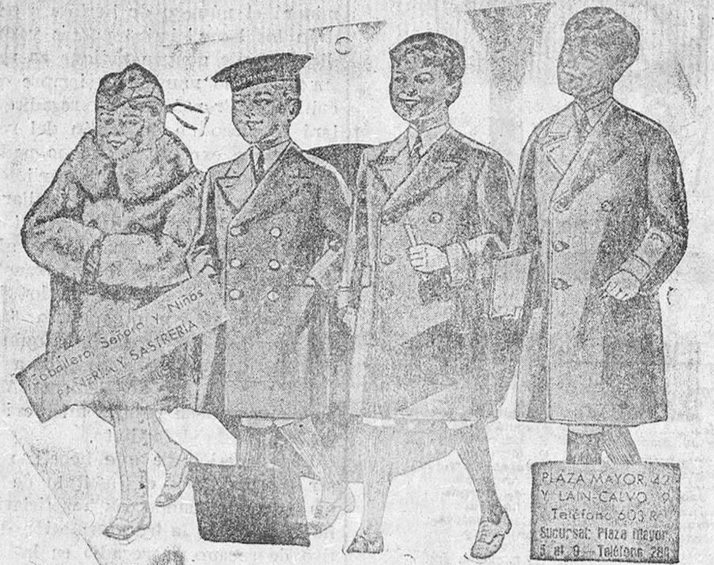
Abriguitos para niños, modelos novedad, de 15, 18, 20, 25 y 30 pesetas.

Opinión blanco e impresora de en la Administración de este periódico