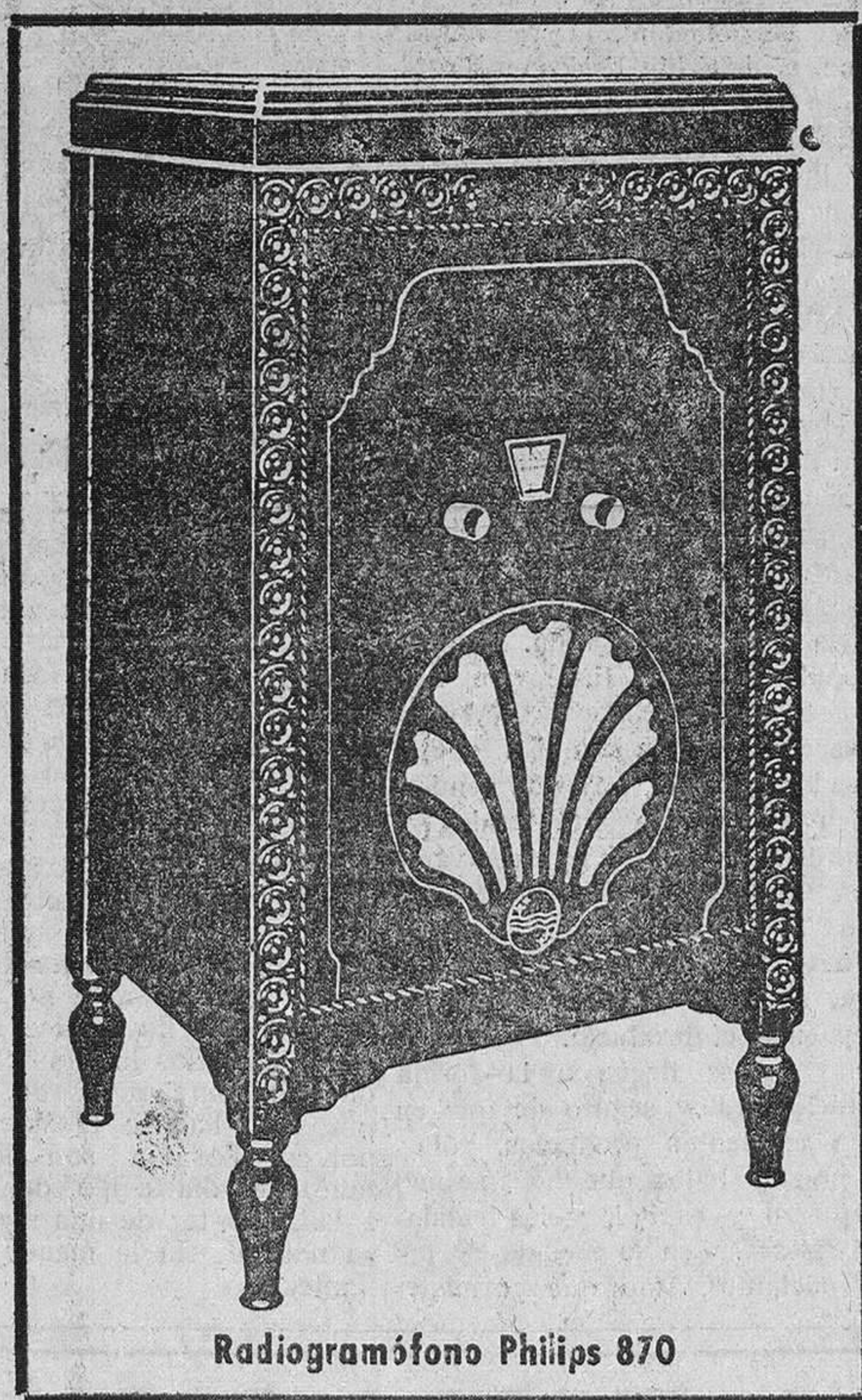
Radiogramófono Philips 870

Un aparato que solo alcance media docena de emisoras no le ha de satisfacer; al mes querrá cambiarle por otro mejor y nadie se lo tomará. Encontrará muchos receptores de resonantes marcas y a bajo precio, pero con ellas no sabrá lo que es la radio.