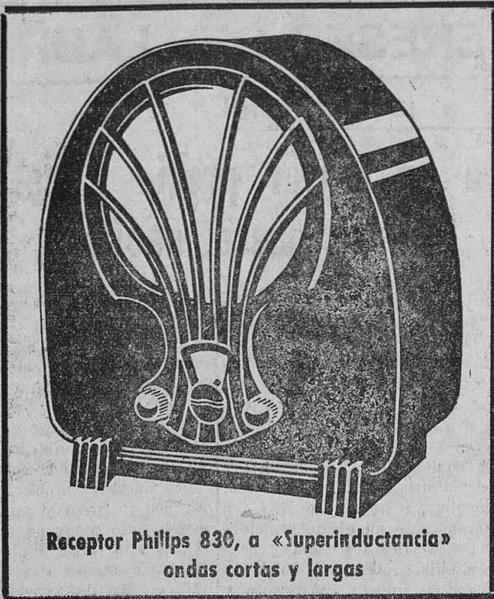
Receptor Philips 830, a «Superinductancia» ondas cortas y largas

Un receptor de radio debe servirle, no solamente durante unos meses, sino durante muchos años