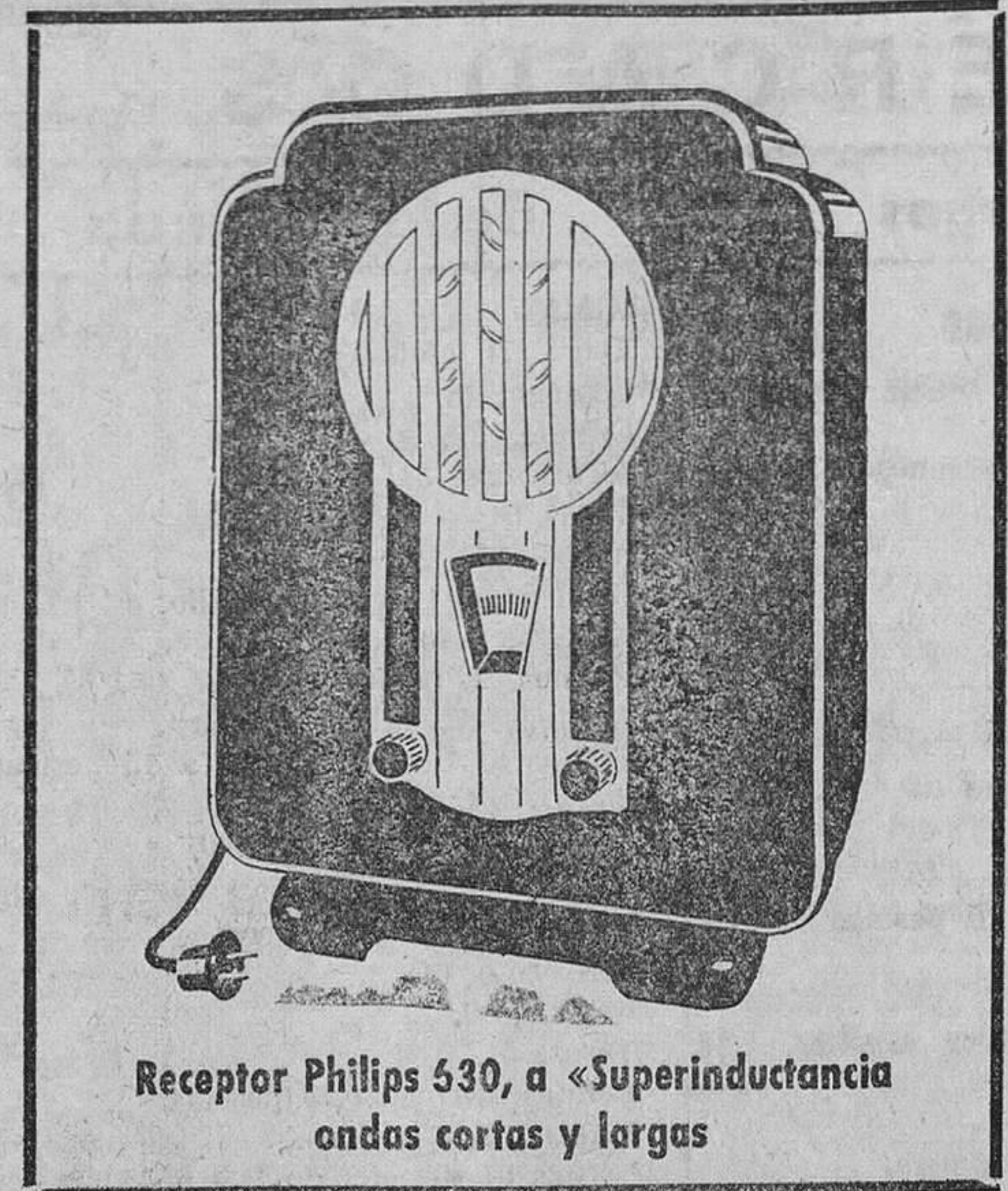
Receptor Philips 530, a «Superinductancia» ondas cortas y largas

Un receptor de radio debe servirle, no solamente durante unos meses, sino durante muchos años