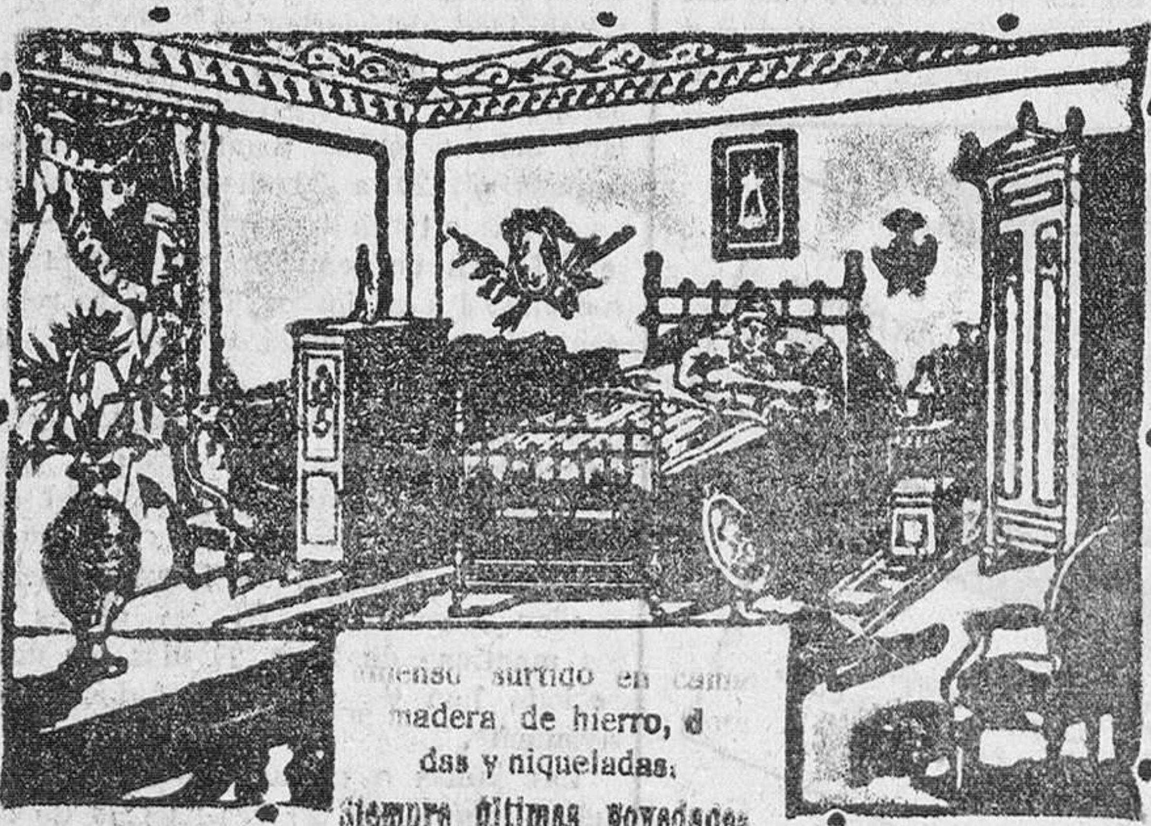
Vea el nuevo "somier", todo hierro, modelo patentado. Es muy cómodo, forjado y muy resistente.

Plaza de Victoria, número 14. — BURGOS En esta Casa se vende el somier "Numancia"