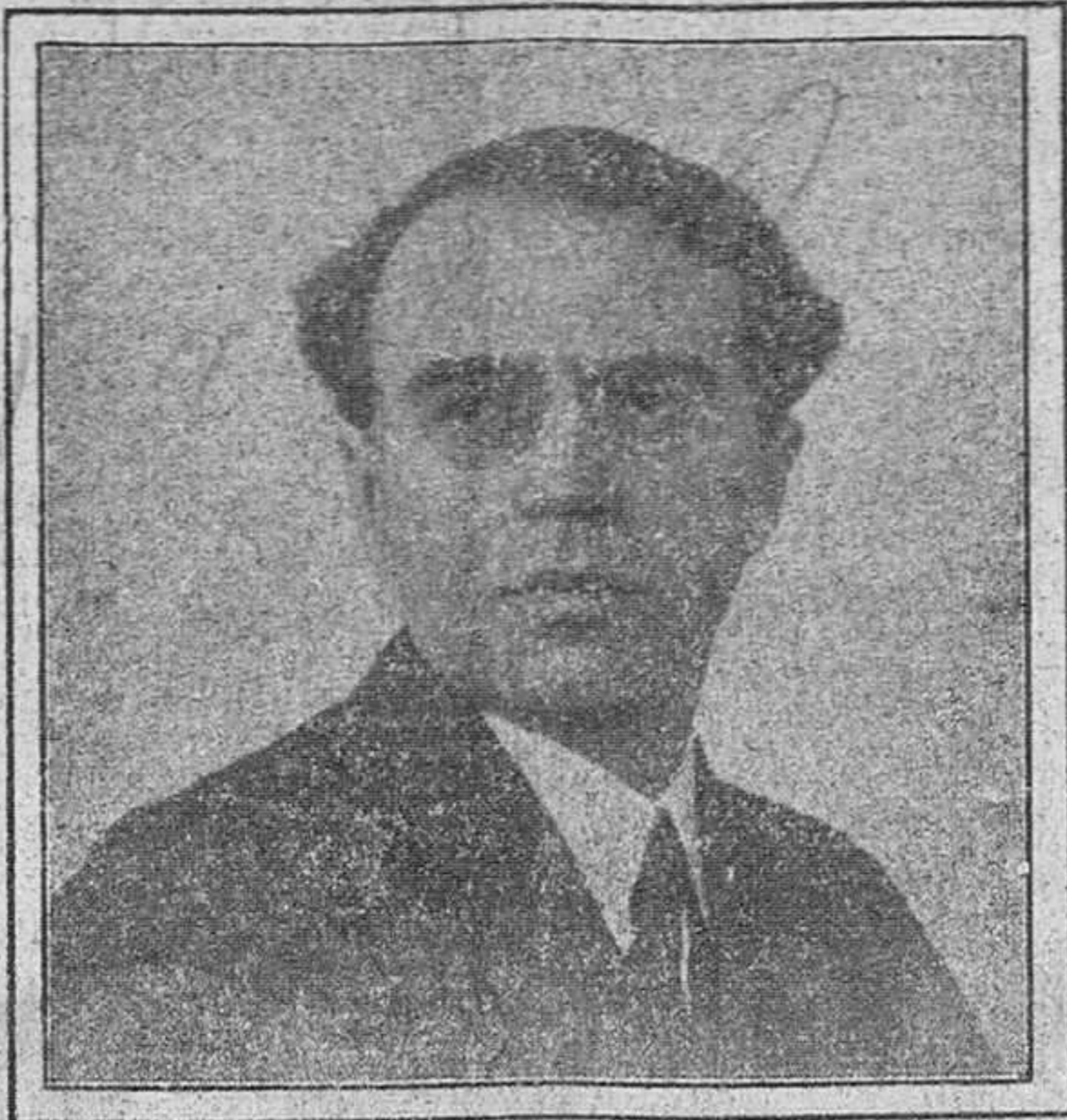
El maestro Valentin Mersky, que, con indubitable acierto, dirige la orquesta rusa y que ha merecido los más cálidos elogios por parte de la crítica.