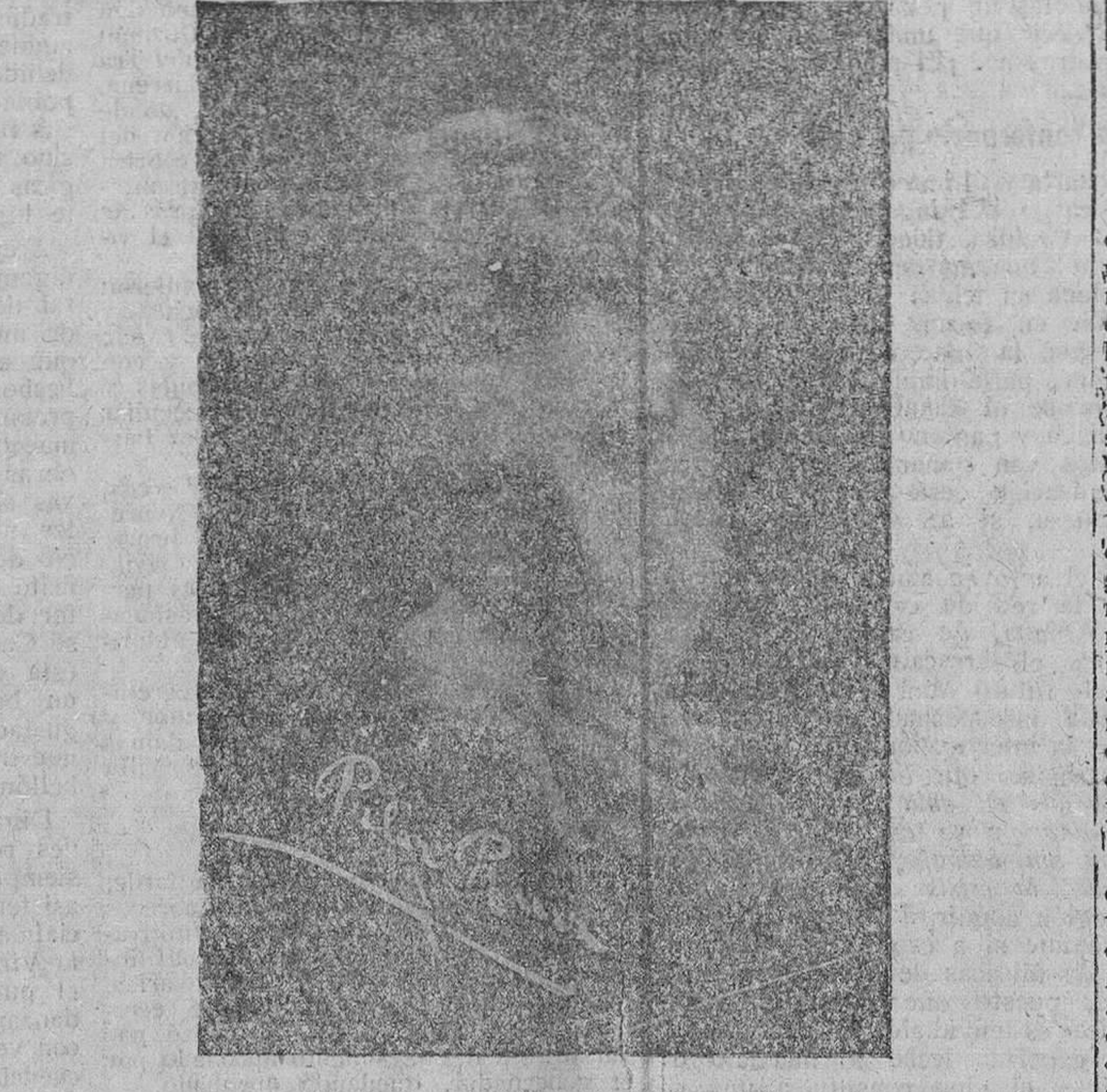
PILAR RUIZ Genial estrella de la canción, que actuará el sábado y domingo en el TEATRO PRINCIPAL

SE LES ADVIERTE QUE NO SE DEVUELVEN LOS ORIGINALES NI SE SOSTIENE CORRESPONDENCIA