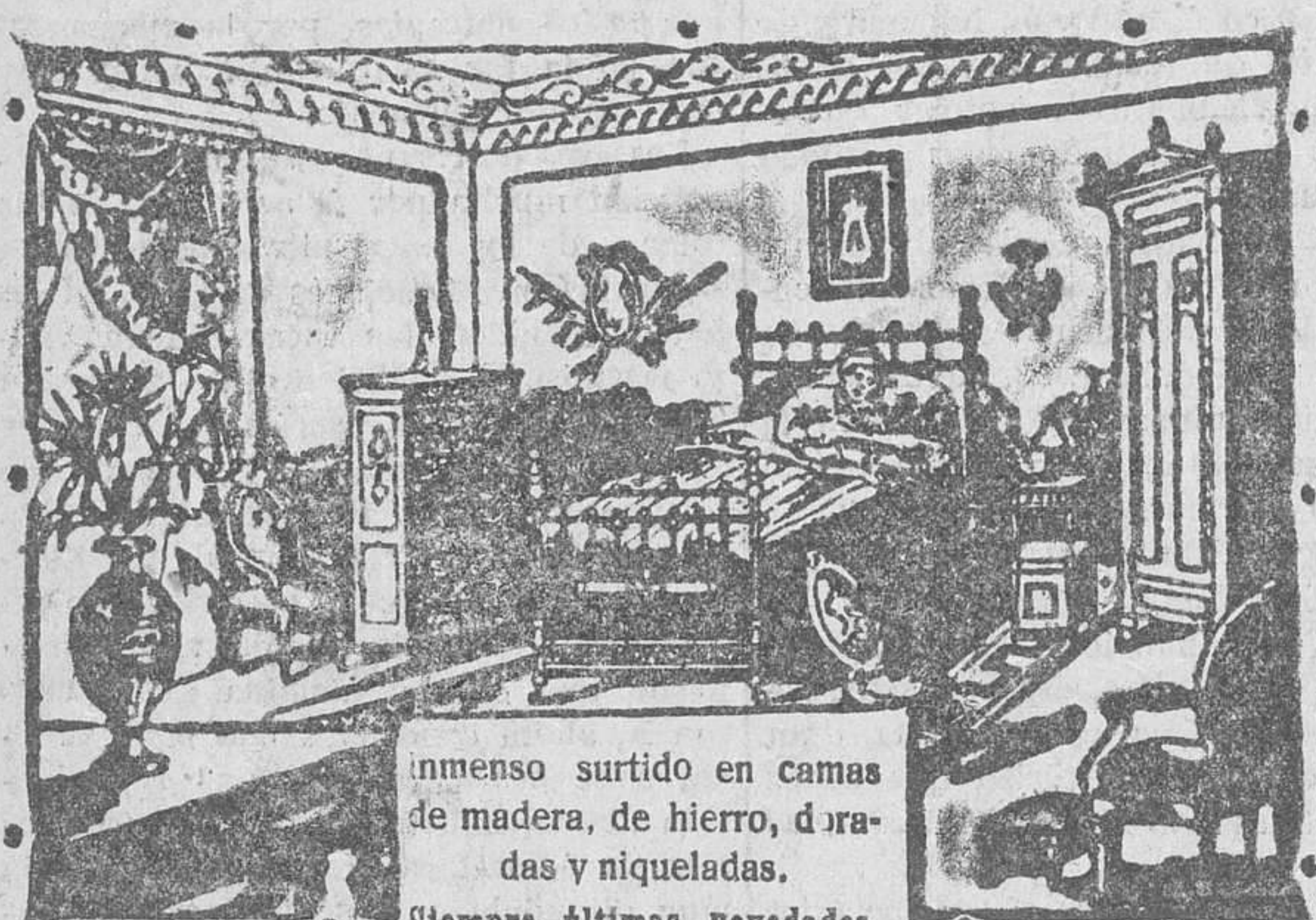
Vea el nuevo sommier, todo hierro, modelo patentado. Es muy limpio, fortísimo y muy económico.

¿Quiere comprar camas y muebles de toda confianza a precios baratísimos? Visite la Gran Bretaña en Burgos