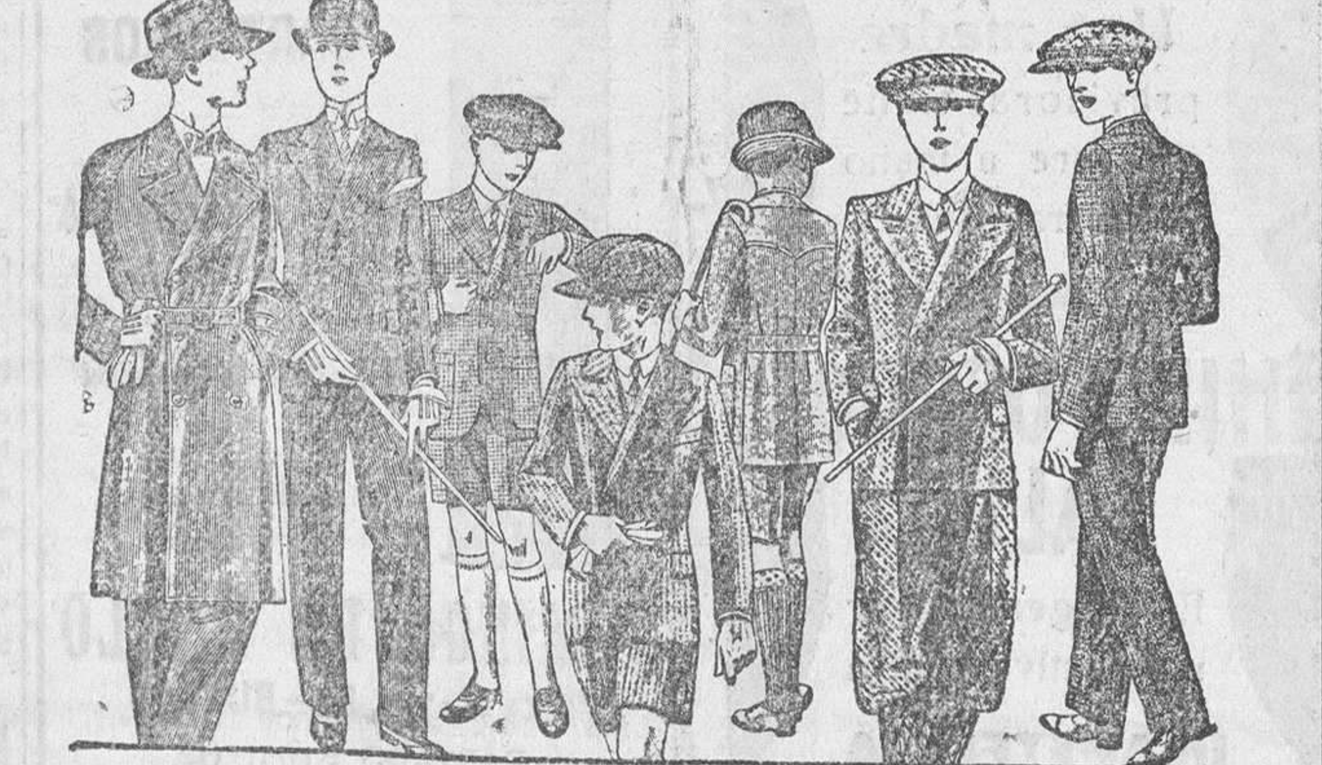
TRAJES Y TRINCHERAS para jovencitos de 10 a 18 años, en diferentes modelos, de paño, dril y lanilla de 25, 30, 35, 40, 50 y 60 pesetas Confección fina y esmerada / Sastrería y pañería / Corte moderno.

Siempre grandes existencias encontraran en Casa Munguia Plaza Mayor, 42, v. Lain-Calvo, 9 y 11.-BURGOS