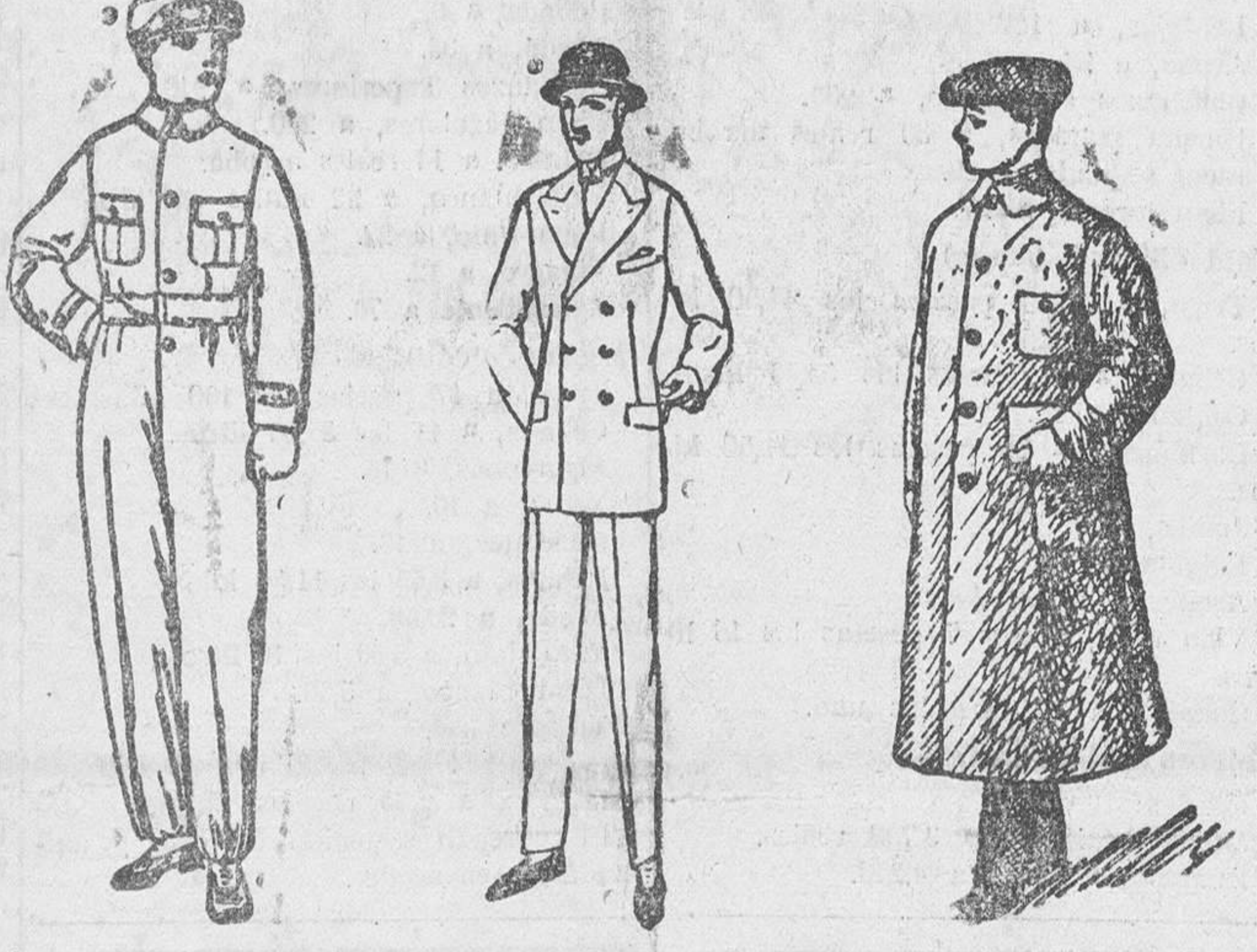
Buzos azules, color kaki y blancos, a 8, 10 y 15 ps. Trajes de confección fina, a 50, 60, 70 y 90 ps. Guardavientos en color gris y kaki, de 7 a 20 ps.

Gran casa de tejidos y ropas confeccionadas PARA CABALLERO, SEÑORA, JOVENES Y NIÑOS SASTRERIA Y PANERIA T LEFONO 603 R Establecimiento Oficial del Turing Club Español