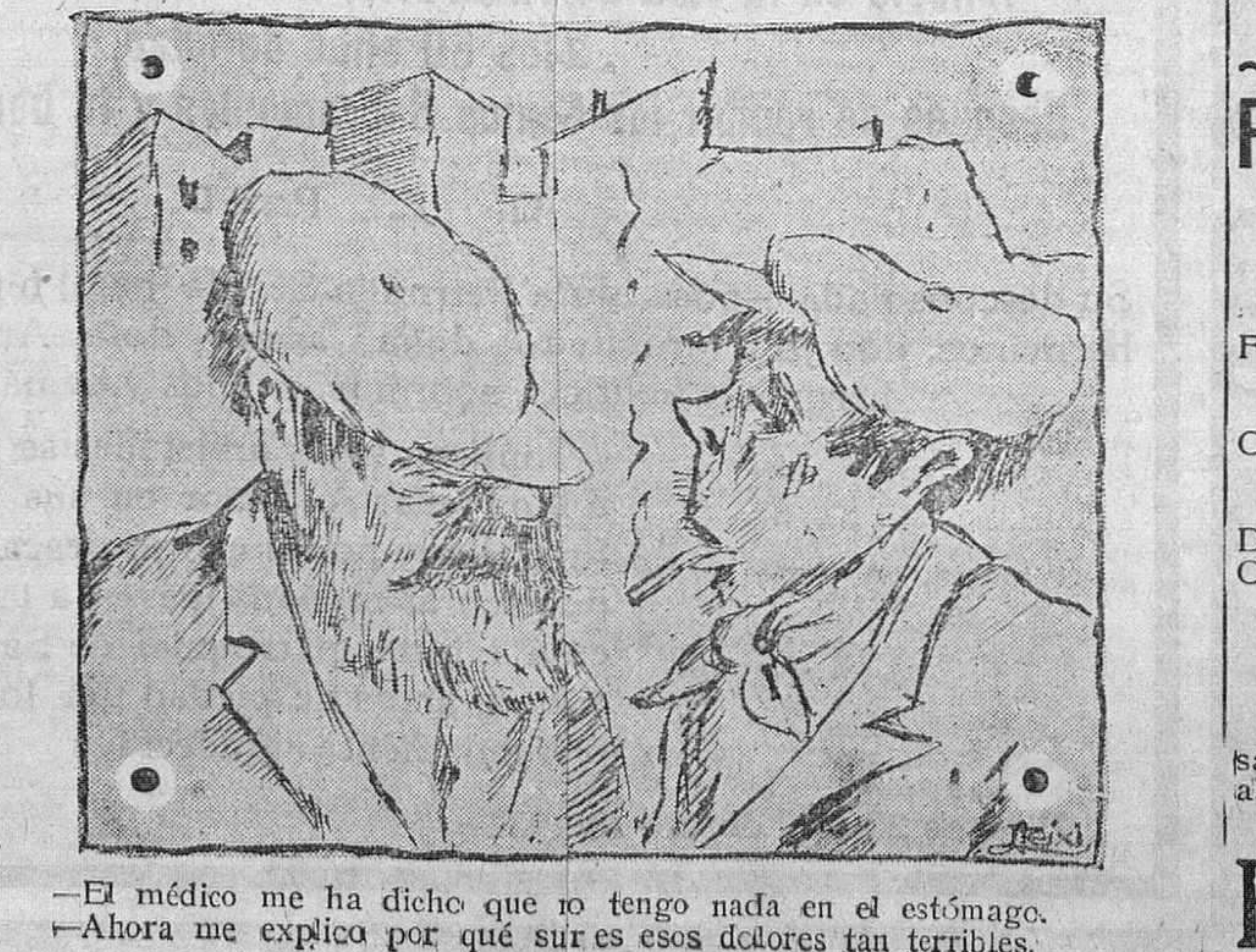
—El médico me ha dicho que no tengo nada en el estómago. —Ahora me explica por qué surten esos dolores tan terribles.